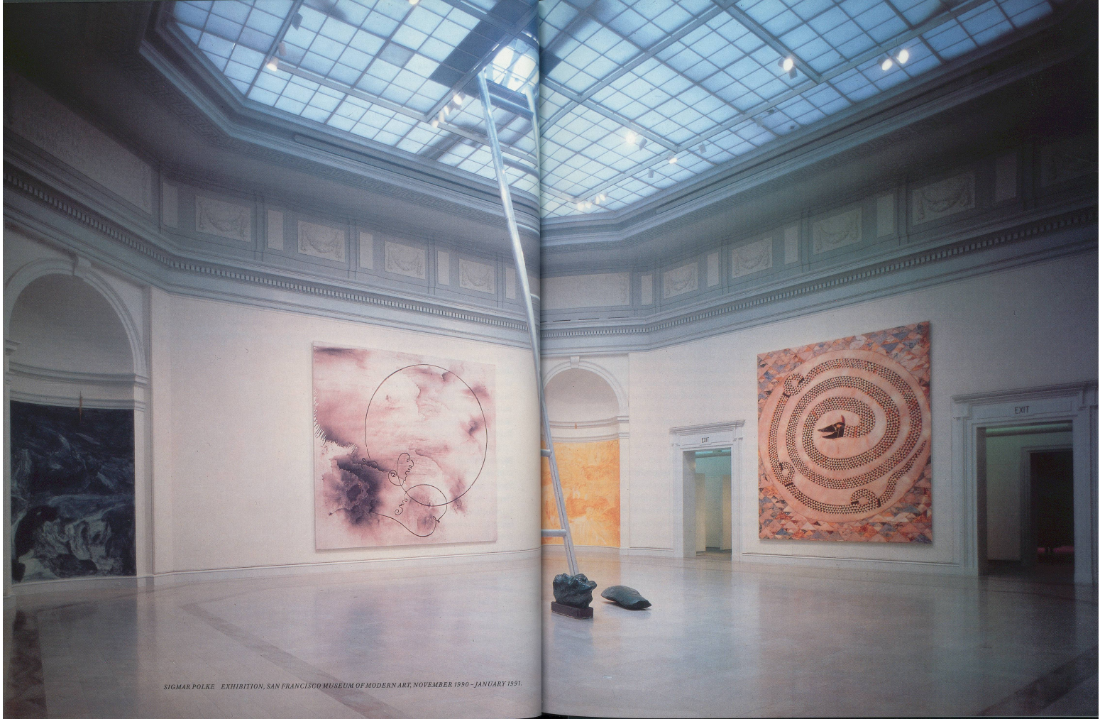
SIGMAR POLKE EXHIBITION, SAN FRANCISCO MUSEUM OF MODERN ART, NOVEMBER 1990 - JANUARY 1991.