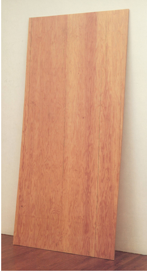
LINSULIT, ROBERT GOBER, SPENGLER, 1982, formitas Panamés, 242 x 118 x 1,6 cm (Plywood, 1987, laminated fir, 35% x 46% x 1/4") RECHTS/RICHT, LOUISE JOUJOUROUS, CELL ZELLE, mixed media, 1991.