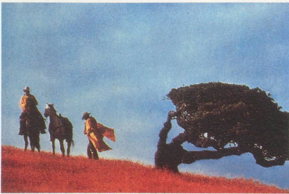
RICHARD PRINCE, UNTITLED (COWBOYS), 1989, Ektacolor print, 47 3 / 8 x 71 1 / 2 / 121,3 x 180 cm.

ers a mechanism for producing a very specific and enormously powerful sense of self — of one's place in time, in relation to others, and in relation to pleasures — and details its effects.