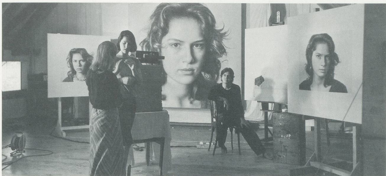
ATELIER VON FRANZ GERTSCH MIT CHRISTINA, 1983/

FRANZ GERTSCH'S STUDIO WITH CHRISTINA, 1983.