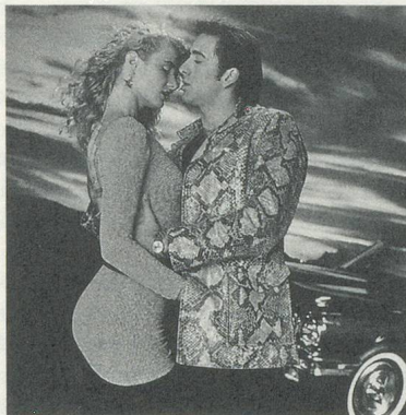
LULA AND SAILOR IN WILD AT HEART