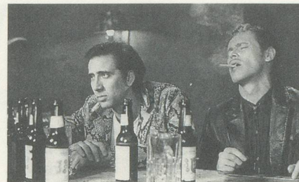
SAILOR AND BOBBY PERU IN WILD AT HEART

David gets back to the high brow and drops the horror of Gothic England for the wonder of serious sci-fi. He also learns about shooting big bucks in the studio crap game. Frank Herbert, H. R. Giger... and Sting? They call it Dune . Tim sticks to a low budget and makes a humble pomo masterpiece with the help of a very popular Saturday morning kid's show host—Pee Wee Herman. Jeff Koons sees Pee Wee's front garden and calls it art.