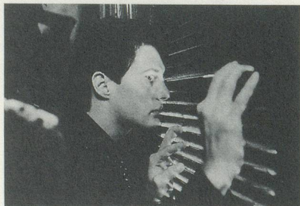
JEFFREY IN BLUE VELVET

KATHY ACKER s neustes Buch In Memoriam to Identity kam letztes Jahr bei Grove Press heraus.