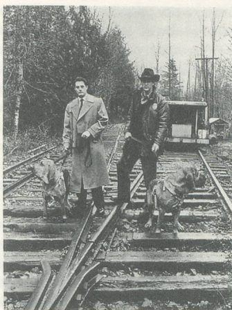
STILL FROM TWIN PEAKS

KATHY ACKER's most recent novel, In Memoriam to Identity , was published last year by Grove Press.