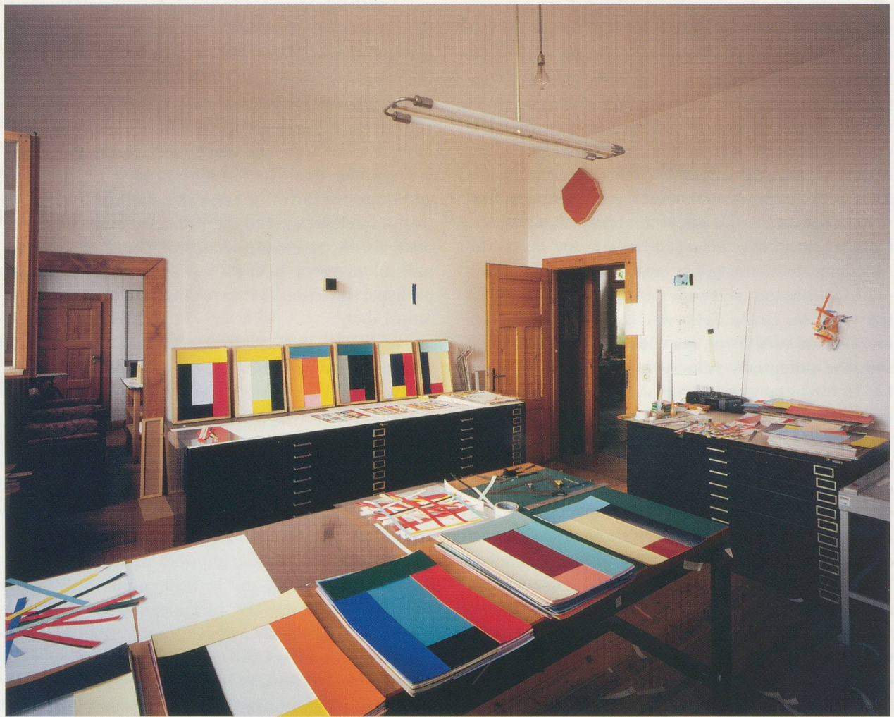
ATELIER / STUDIO IMI KNOEBEL, DÜSSELDORF 1991.

support a crowning one, yet enclose the lower—pieces of a rectangular puzzle that always fit together in the same configuration. It is within this regimented, and repetitious sequence that Knoebel assigns a different color to each panel, constructing relationships among these five parts. Color emerges as the primary structuring and descriptive trait. While each painting is composed of a unique combination of colors, certain resonances between and among paintings in the series are effected. Knoebel's studio is like a laboratory in which he conducts experiments of tone, hue, shades, and light, inventing not only combinations of color but their actual concentration and