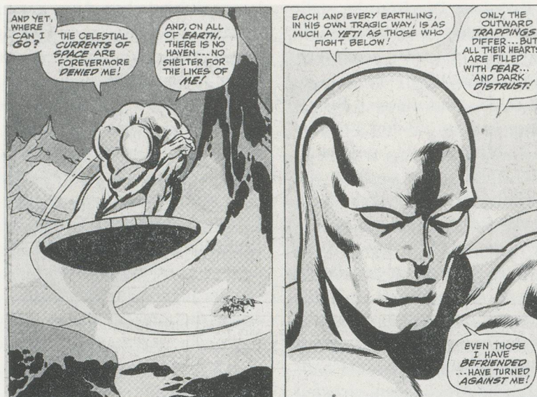
Aus / From: THE SILVER SURFER, © 1979 MARVEL COMICS GROUP.

Kultur wie den Comics erlangen. Ob in der erhabenen Form bei Camus oder in der trivialen der Comics: Der Gehalt erweist sich als durchaus gleichwertig. Nehmen wir zum Beispiel jenen tragischsten aller philosophisch veranlagten Superhelden, den Silver Surfer. Sich freiwillig in sein Schicksal als Sklave des allmächtigen Galactus fügend (eine Vereinbarung, der er zugestimmt hatte, um seinen Heimatplaneten zu retten 3) ), kreuzt der Silver Surfer über die monatlichen Seiten seiner Fortsetzungsexistenz, um unentwegt harte Körperarbeit zu verrichten, die den Sisyphos von seinen Göttern gestellten Auf-