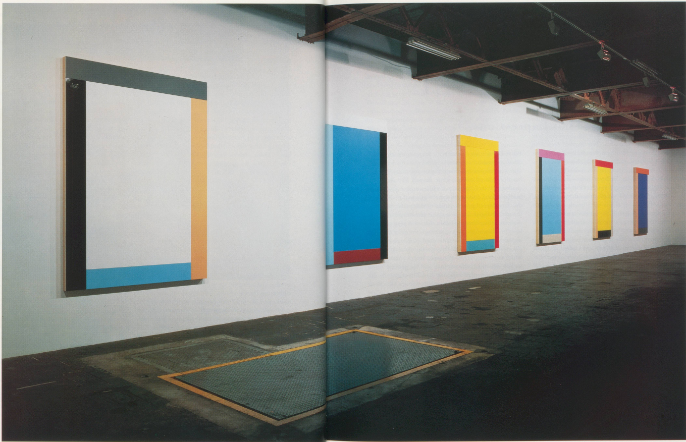
AMI KNOBELL, GRACE KELLY, 1991, INSTALLATION AMERI KAGIDA GALLERY TAIRA