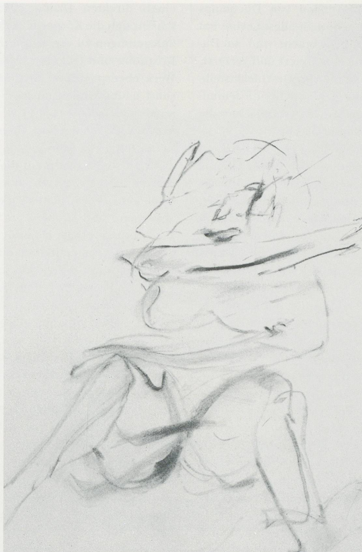
SHERRIE LEVINE, AFTER WILLEM DE KOONING: 5, 1981, charcoal on paper, 14 x 11" / Kohle auf Papier, 35,5 x 28 cm.

monströs anhäufen und schliesslich ihre Besitzer und die Wohnung überwältigen, spriessen Levines nutzlose Billardtische mitten aus einem Bild von Man Ray. An diesem Punkt in ihrer langen Reihe von «Nach(berühmten modernen Künstlern)»-Werken verliert die Repetition ihre einstige Treue zu gewissen materiellen Aspekten des Werks wie Technik, Grösse, Farbe und/oder Inhalt. Die Photographien und Drucke waren zwar nicht immer massstabgetreu,