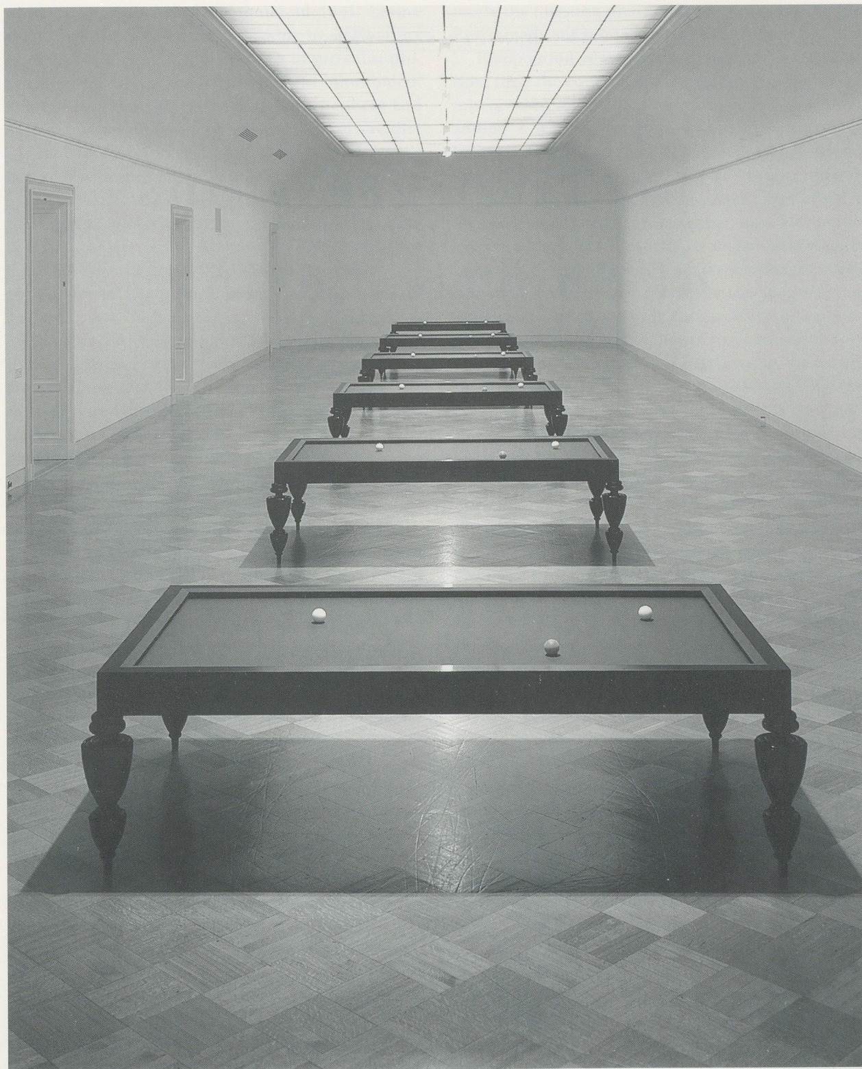
SHERRIE LEVINE, LA FORTUNE (AFTER MAN RAY) , 1990, San Francisco Museum of Modern Art Installation, felt, mahogany and resin, 33 x 110 x 60" / Filz, Mahagoni und Lack, 33,8 x 280 x 152,5 cm.