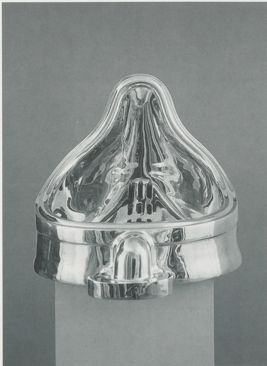
SHERRIE LEVINE, FOUNTAIN (AFTER MARCEL DUCHAMP), 1991, cast bronze, 15 x 25 x 15" / Bronzeguss, 38 x 63,5 x 38 cm.