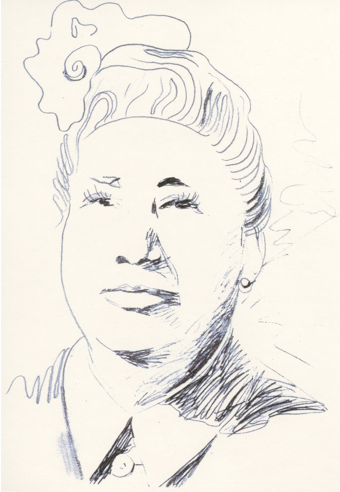
ROSEMARIE TROCKEL, OHNE TITEL, 1992, Fotokopiezeichnung, 24 x 17 cm / Photocopy drawing, 9 1/2 x 6 7/8"