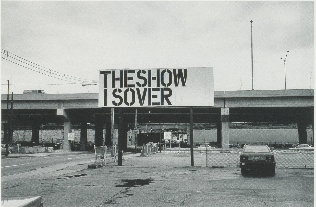
CHRISTOPHER WOOL, BILLBOARD CARNEGIE INTERNATIONAL PITTSBURGH, 1991.