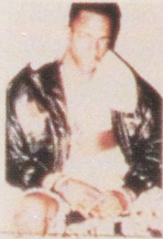
My girl friend My boy friend's My wife