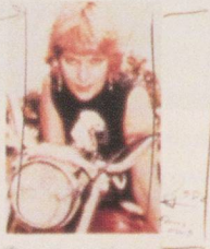
My girl friend My boy friend's My wife