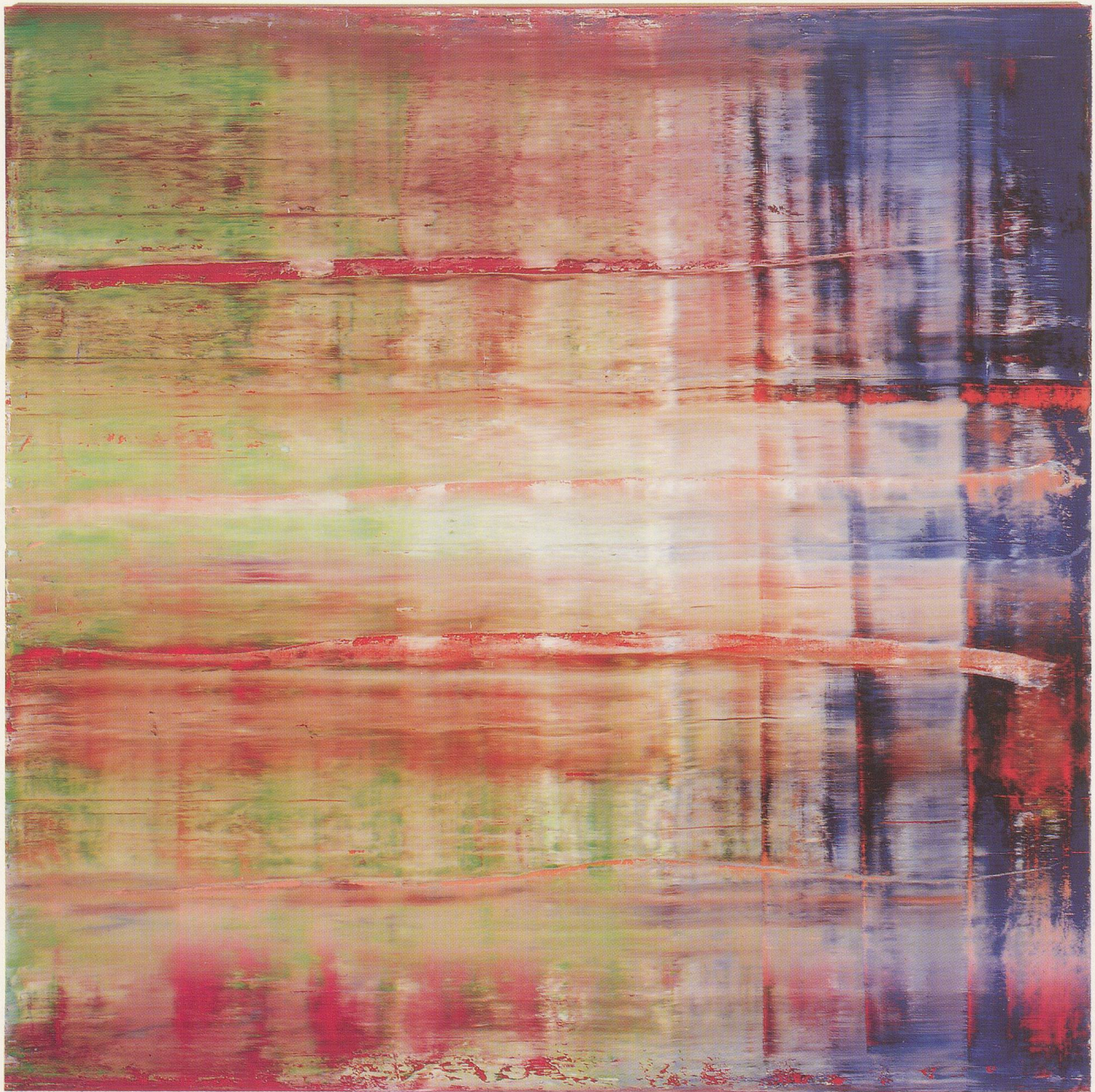
GERHARD RICHTER, ABSTRAKTES BILD (786), 1992, Öl auf Leinwand, 300 x 300 cm / ABSTRACT PAINTING (786), 1992, oil on canvas. 118 \frac{1}{8} x 118 \frac{1}{8} ".