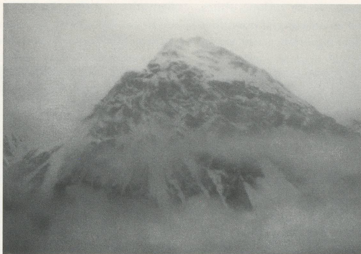
GERHARD RICHTER, BERG , 469-2, 1981, Öl auf Leinwand, 70 x 100 cm / MOUNTAIN , 469-2, oil on canvas, 27½ x 39¾".

like Gerhard Richter and Andrew Warhola under conditions of absolute doubt—with the understanding that, as long as doubt remained an agency, and the painting it entailed affirmed that doubt, it could neither disintegrate into despair nor transcend into monadic assurance, but would remain, instead, always an absolute permission.