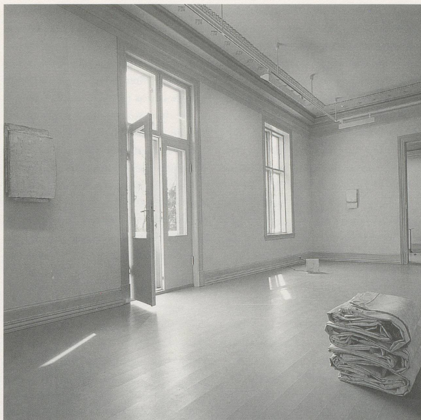
LAWRENCE CARROLL, Installation in «Privat», 1993, Moss, Norwegen / Norway

Eine Möglichkeit ist, das Grandiose durch das Bescheidene, Intime und Private zu ersetzen. Und was ist das Pri-