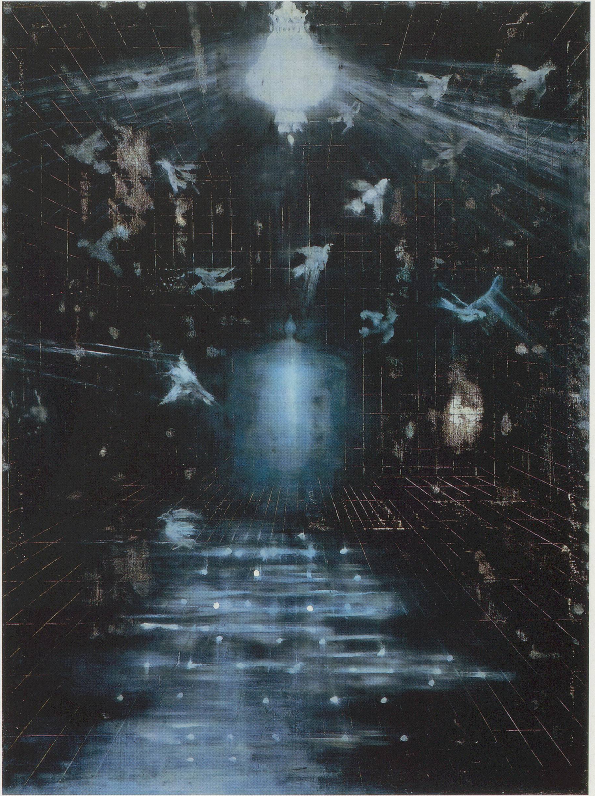
ROSS BLECKNER, THE FOURTH EXAMINED LIFE , 1988, oil on canvas, 96 x 72" / DAS VIERTE UNTERSUCHTE LEBEN , 1988, Öl auf Leinwand, 244 x 183 cm.