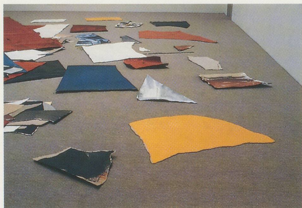
ADRIAN SCHIESS, FETZEN , 1984,

stimmtes visuelles Angebot an die gegebene Architektur darstellen: Das Konzept der Komposition soll auch nicht durch die Hintertüre ins Spiel kommen. Damit wird die Architektur auf ihre eigenständige Qualität verwiesen, der sich der Künstler nur bedient, um das Werk zu zeigen, das am Ende nicht mehr und nicht weniger sein will als eine im Ansatz grenzenlose Ausbreitung von Farben. Hinter diesem Vorgehen verbirgt sich nicht zuletzt auch ein grosser