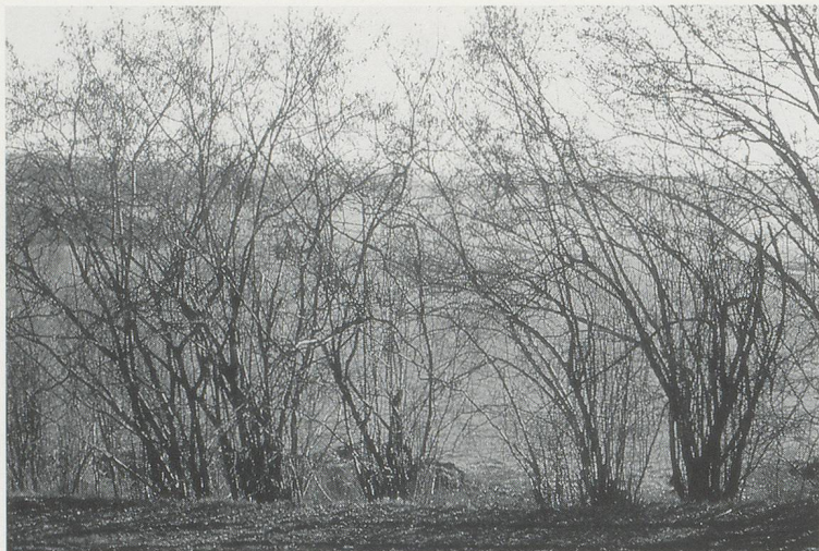
HASELNUSSBÜSCHE / BUSHES OF HAZELNUT. (PHOTO: WOLFGANG LAIB)

which comprise his own work, materials that have a reality and energy all their own, and are affected by time in a way that is very different to a painting. "With the milkstones, the milk is what it is," namely an opaque, viscous substance full of nutrients that is perishable, intimate, and pure, and contained in collective memory. "It's not a white paint. I could not create the milk, and that is the chance, that is what is beautiful and important." In the same way, the beeswax, scented and golden with an almost tangible energy and warmth, is vastly different to any material the artist might be able to fabricate himself. "It's a material that I did not make. It's the building material of the bees. When you have a piece of beeswax next to a table or a chair, it's another world. It's like there are worlds in between..."