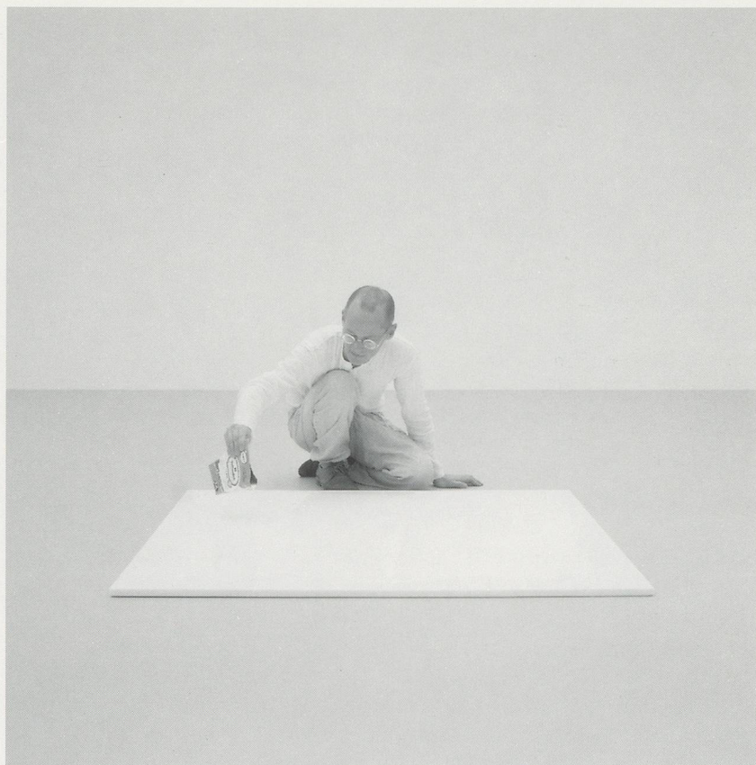
WOLFGANG LAIB, MILCHSTEIN, 1987/89, weisser Marmor und Milch, 122 x 130 x 2 cm / MILKSTONE, white marble and milk, 48 x 51 x 3/4". Installation 1992/93, Kunstmuseum Bern.

1) Laib's statements in this text have been taken from a conversation between the artist and the author, recorded in London on 24 October, 1993.