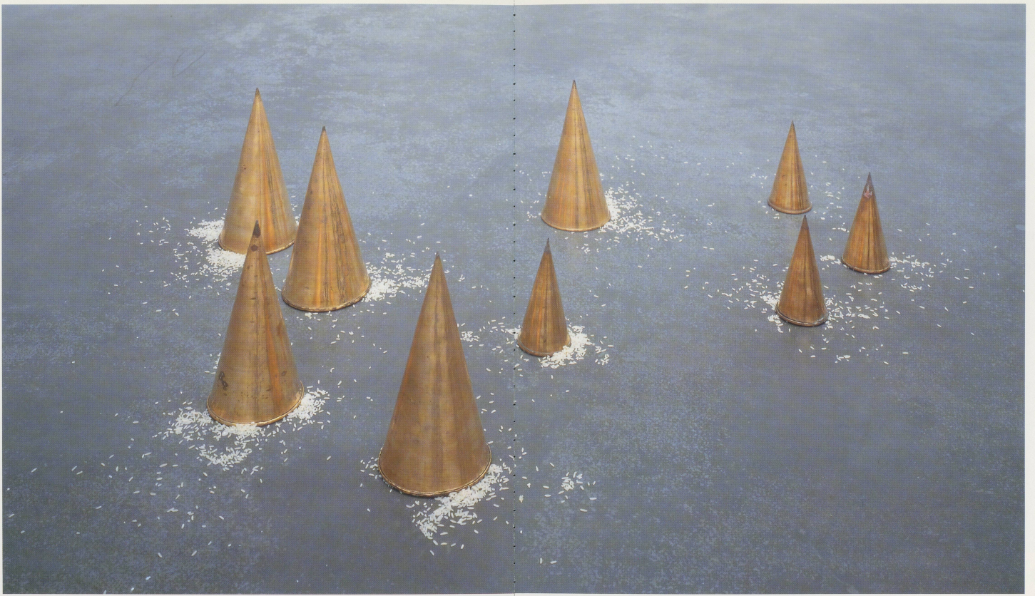
WOLFGANG LAIB, DIE REISMAHLZEITEN FÜR DIE NEUN PLANETEN, 1983, Reis, Messing, 1983, 17–35 cm / THE RICE MEALS FOR THE NINE PLANETS, rice, brass, 6 7/8 x 13 3/4", Installation 1993/94, De Pont Foundation for Contemporary Art, Tilburg, Holland.