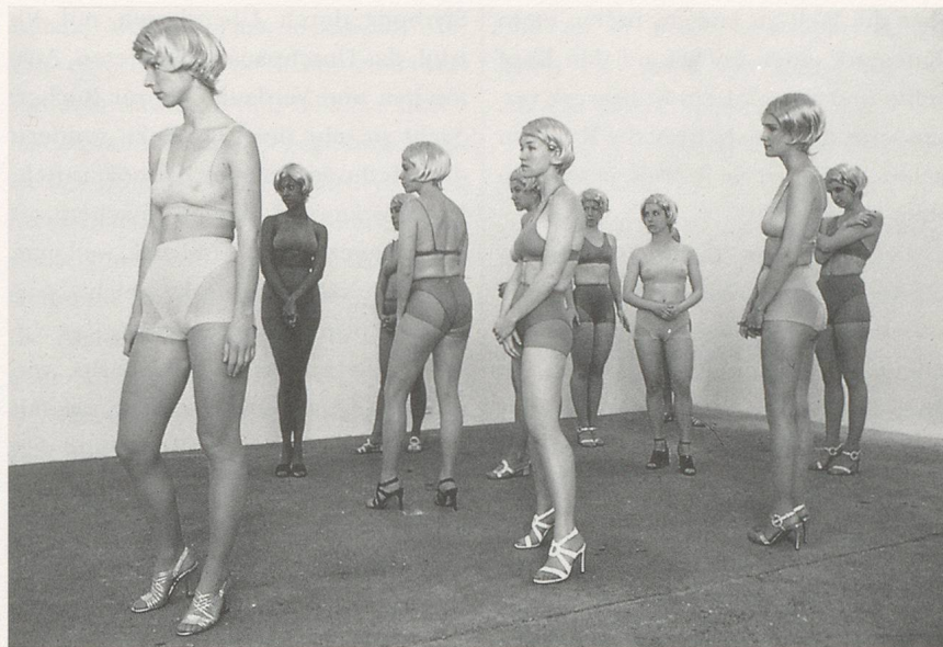
VANESSA BEECROFT, CLOSE UP , 1996 / NAHAUFNAHME, Performance, Jeffrey Deitch Projects, New York.