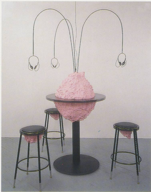
CHARLES LONG, BUBBLE GUM STATION, 1995, modeling clay, sound equipment and furniture, 91" high, 60" diameter /

KAUGUMMISTATION, Modelliermasse, Sound-Equipment und Möbelstücke, Höhe 231 cm, Durchmesser 152 cm.