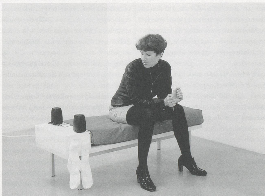
ANGELA BULLOCH, FORMATION DANCING BENCH (VIRTUAL HMMM) , 1996, bench, cushion, socks, walkman, loudspeaker system, sound tape, electronic equipment, 57 x 17¾ x 18½" / FORMATIONSTANZ-BANK (VIRTUELLES HMMM), Bank, Kissen, Socken, Walkman, Lautsprecher, Tonkassette, div. Elektronik, 145 x 45 x 47 cm.

AB: So far I've projected a new name onto it. As there is no public access to it, I would like to permanently install one work to be remote-controlled by people on the shore. I've thought of other events as well. It should be a platform for art.