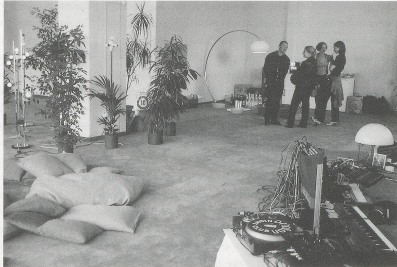
Kombirama, Zurich, July 1996.