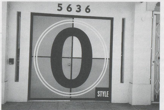
Los Angeles, 1995.