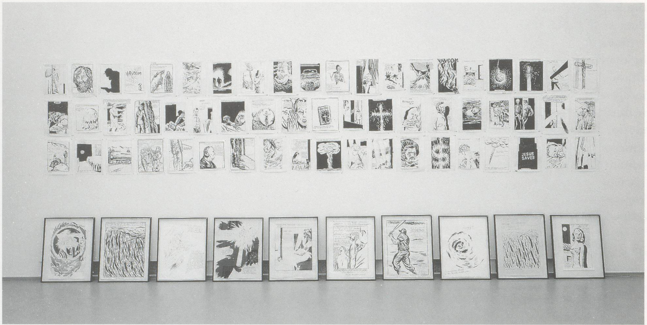
RAYMOND PETTIBON, installation view / Ausstellung 14/16 Verneuil, Marc Blondeau, Paris 1995.

There was little sense of waiting for a conclusion—the process Pettibon had set up had no such rise or fall to it. In fact, I can't remember how the session ended. All I do know is that eventually it did, and Pettibon told those of us who had made drawings to pin them on the wall among his if we liked. Oddly, some asked for his signature on the bottom of their sheets, suggesting that, although many different hands had been at work, Pettibon was ultimately the author of them all.