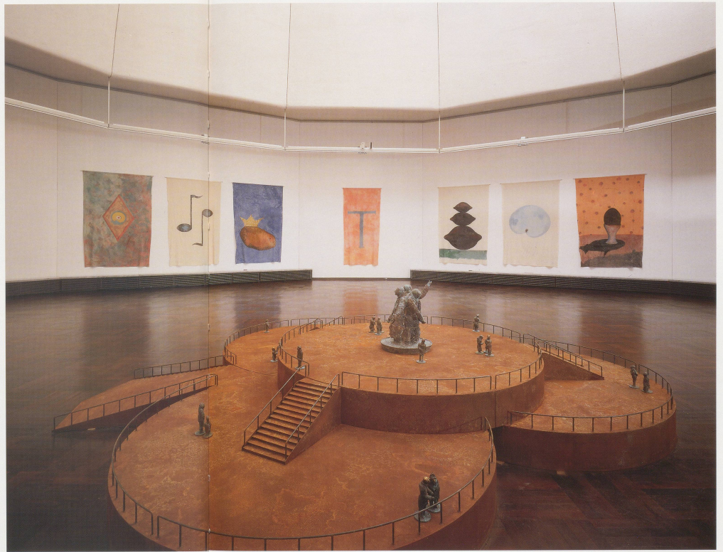
THOMAS SCHÜTTE, GROSSE RUSPEKT, 1994, Stahl und Bronze, Durchmesser 480 cm / 15' 9" diameter, DEKA FAUNEN 1989/90, StgG, Nr. 200 x 130 cm, Installation Würzburgerischer Kunsthallen Stuttgart, 1994 / doh, 6' 6", x 4' 3", x 4' 3", arch.