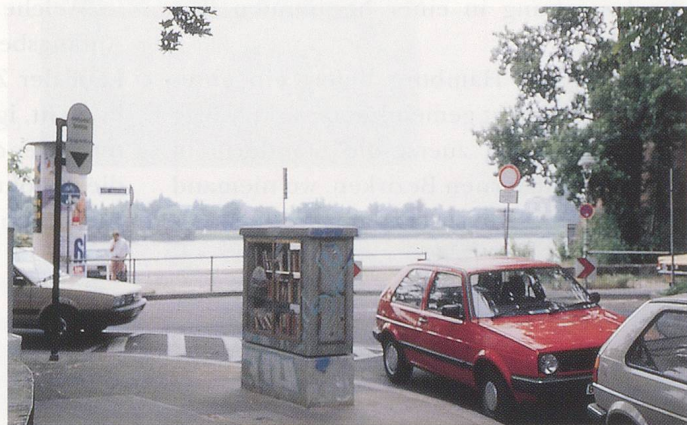
CLEGG & GUTTMANN, DIE OFFENE BIBLIOTHEK, MAINZ, STANDORT NR. 2, 1994 / THE OPEN PUBLIC LIBRARY, MAINZ, LOCATION NO. 2.

Ausfahrtsrampe einer Hauptverkehrsader. Dieser Bücherschrank war nach sechs Wochen leer. 3. Neben den Bahngleisen auf einer Wiese am Stadtrand. Dieser Schrank wurde zerstört (seine Glastüren waren eingeschlagen). Interviews, die Clegg & Guttmann zwei Jahre später mit Passanten durchführten, zeigten jedoch, dass die Leute an allen drei Orten das Projekt in bester Erinnerung hatten; nur wenige äusserten sich negativ. Das zweite Projekt war DIE OFFENE BIBLIOTHEK, HAMBURG (1993), ebenfalls mit