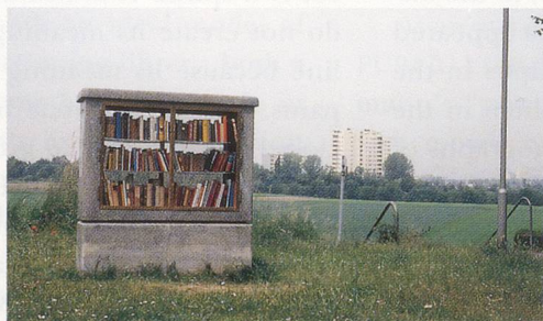
CLEGG & GUTTMANN, DIE OFFENE BIBLIOTHEK, MAINZ, STANDORT NR. 1, 1994 / THE OPEN PUBLIC LIBRARY, MAINZ, LOCATION NO. 1.

Each library project differs somewhat. The bookcases that Clegg & Guttmann designed for Graz were wooden with protective glass doors. Their form and the way they were situated in the landscape evoked the overbearing presence of the massive, modular, low income housing found at the edges of European cities where the urban meets undifferentiated open space. In Hamburg and in Mainz, they transformed faux granite power boxes into book cabinets. Power boxes, those unobtrusive pieces of street furniture, were gutted and their metal doors were replaced by glass ones; fitted with shelves and filled with books, they embodied statements about the intersection of power, knowledge, and communication. Clegg & Guttmann placed these dense, compact, and frontal objects in situations where they engaged the environ-