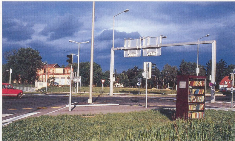
CLEGG & GUTTMANN, DIE OFFENE BIBLIOTHEK, GRAZ, STANDORT NR. 2, 1991 / THE OPEN PUBLIC LIBRARY, GRAZ, LOCATION NO. 2.

varied between 120 and 180 on any given day. Kirchdorf began with about the same stock as Barmbek (around 300 books), but the library was a nonstarter: At the first inventory 90 percent of the books were missing and they were never returned or replaced. 6)