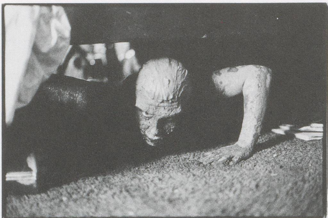
ANN-SOFI SIDÉN, QM, 1997.