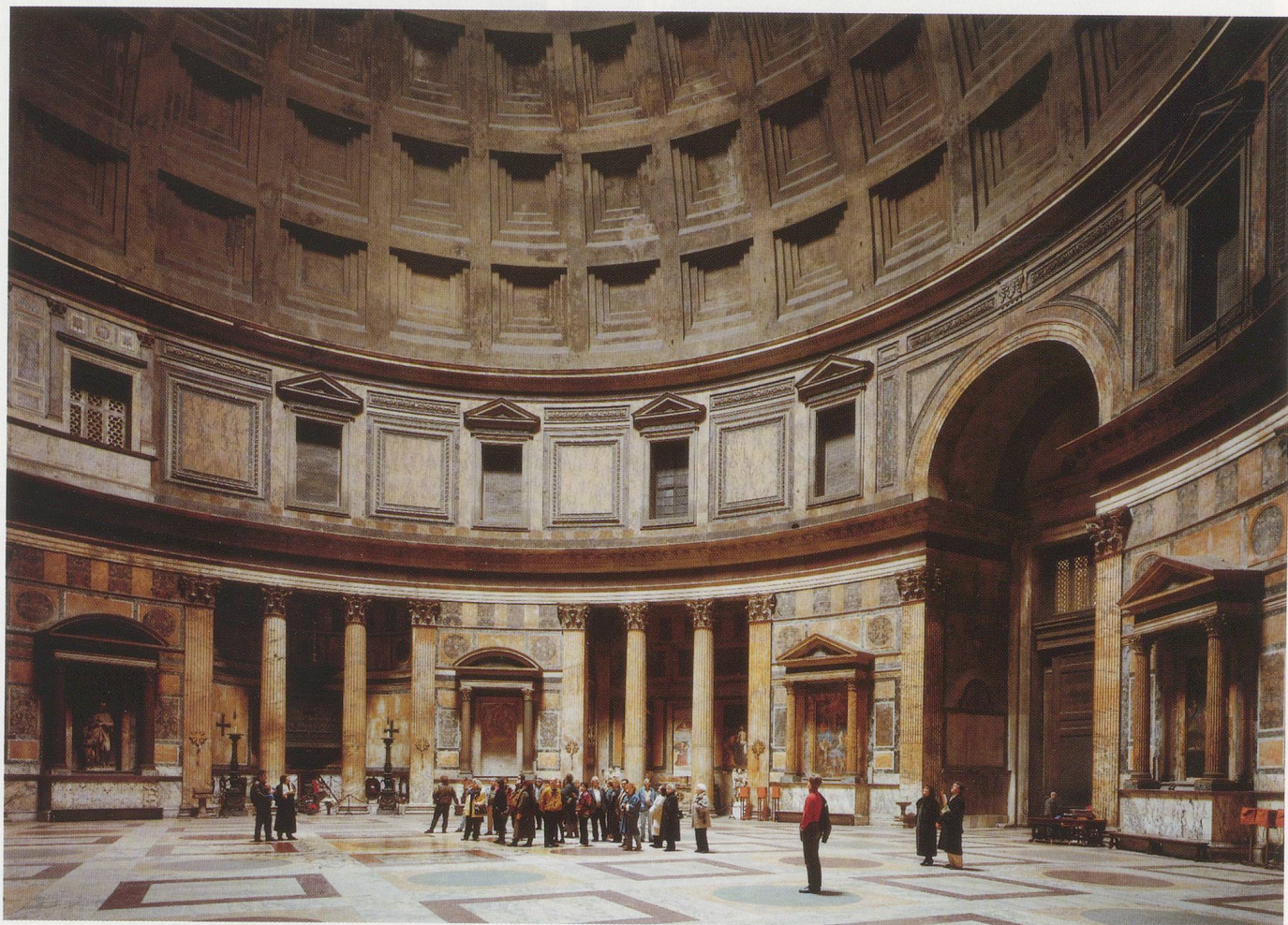
THOMAS STRUTH, PANTHEON, ROM 1990, 184 x 238 cm / 72½ x 93¾".