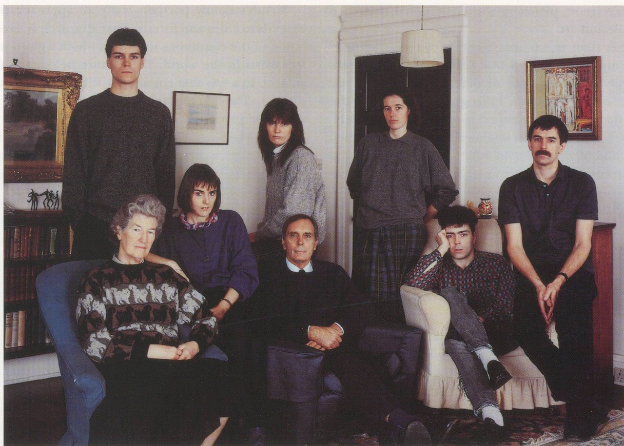
THOMAS STRUTH, THE SMITH FAMILY, FIFE, SCOTLAND 1989 , 100 x 126 cm / 39 \frac{3}{8} x 49 \frac{3}{8} ".

sumes every other consideration, including the worldly, perhaps commercial motives of the work. The work delivers more truth more thoroughly—like a flame so hot as to leave no residue—than anyone could have a reasonable use for. Think of any Atget and of the best Weegee: specificity that swamps expectation. It is as if the subject used the photographer to translate itself into a picture. The photographer's name comes to stand for a set of oddly authorless transpositions—oddly indeed in the case of Atget; whose formal decisions are so exquisite, but whose surrender to banal subjects is innocence itself.