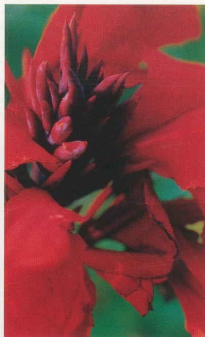
THOMAS STRUTH, PFLANZE NR. 46, CANNA (DETAIL), BOTANISCHER GARTEN DÜSSELDORF 1993, 58 x 46 cm / PLANT NO. 46, CANNA (DETAIL), DÜSSELDORF BOTANICAL GARDEN, 22 \frac{7}{8} x 18 \frac{1}{8} ”.

Struths konservativer Rückgriff auf das Genre ist eine erstaunliche Reaktion auf die Lektionen seiner radikalen Lehrer Bernd und Hilla Becher, deren