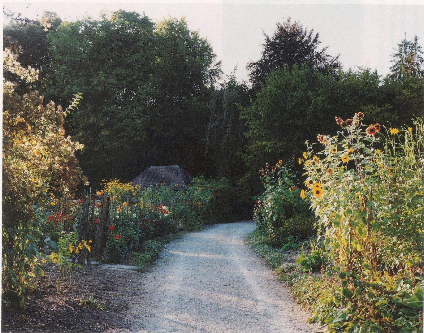
THOMAS STRUTH, GARTEN AM LINDBERG MIT BLUMEN, WINTERTHUR 1991, 70 x 90 cm / GARDEN WITH FLOWERS, LINDBERG, WINTERTHUR (SWITZERLAND), 27½ x 35½".