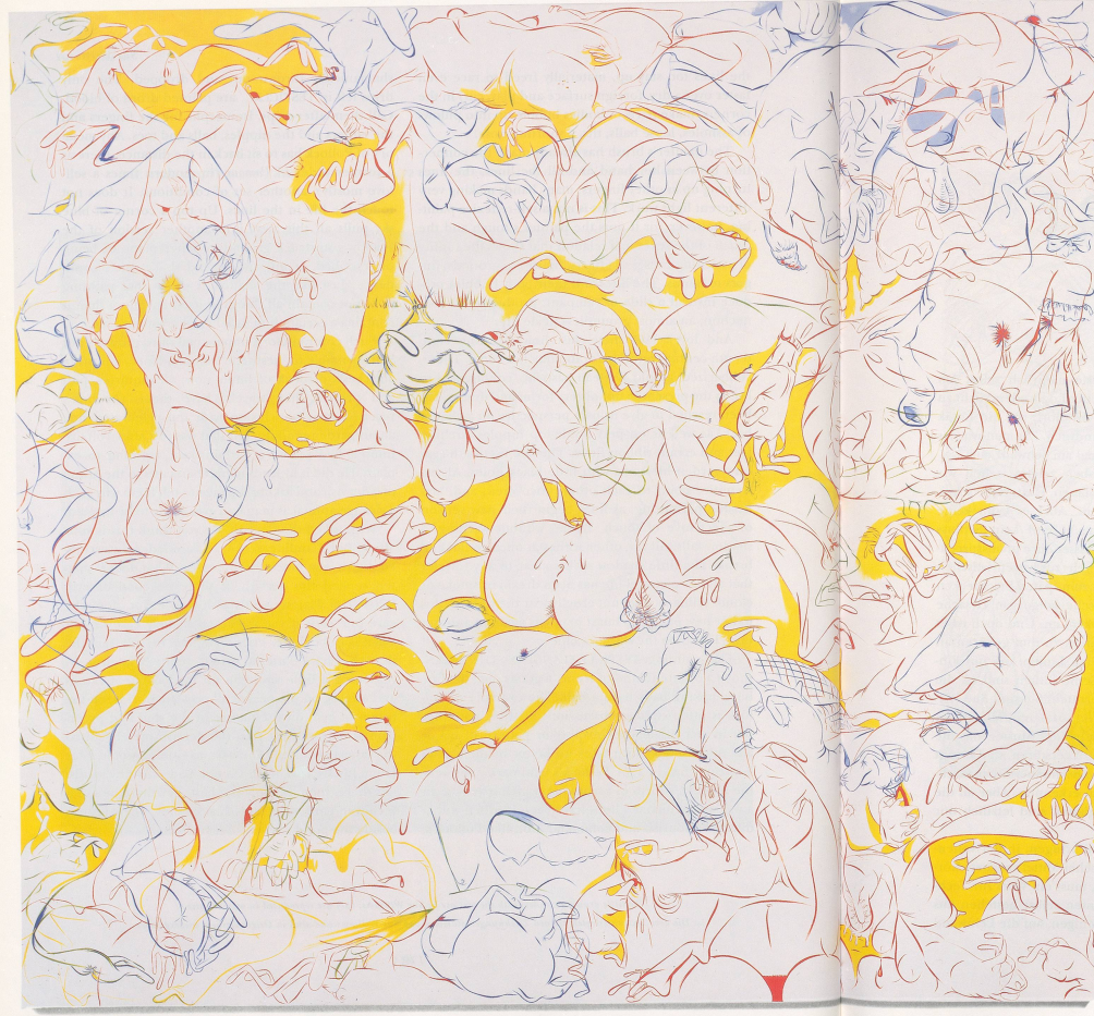
SUE WILLIAMS, TESTICLE FLANGE ON THE GREEN , 1997, oil and acrylic on canvas, 96 x 108" / HODENKLAMMER AUF DEM RASEN. Öl und Acryl auf Leinwand, 244 x 274 cm.