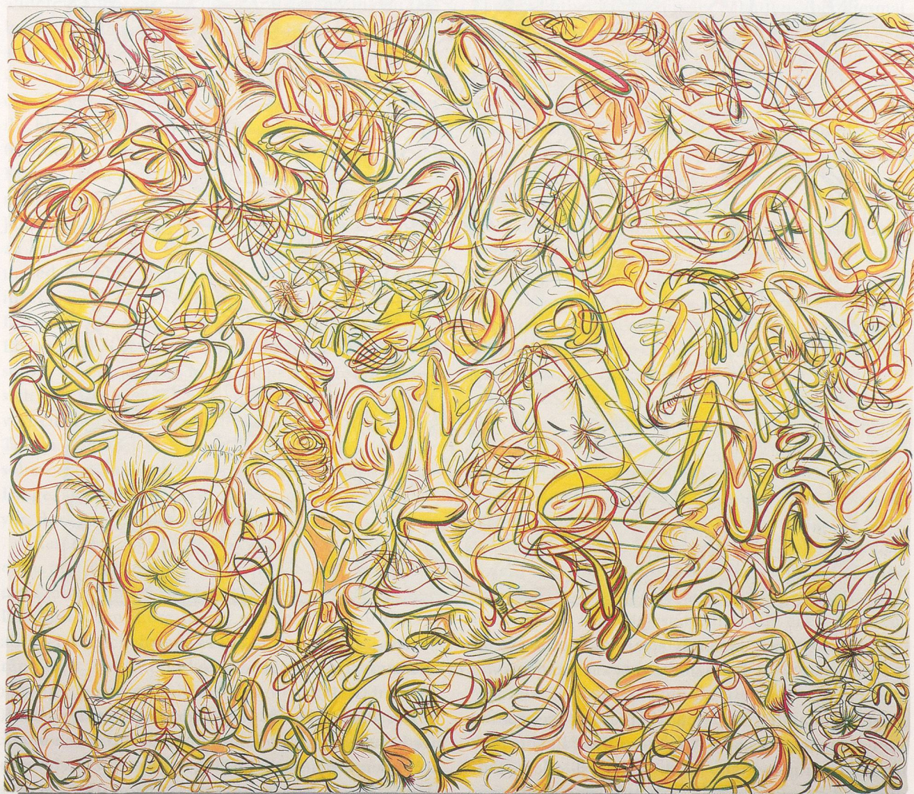
SUE WILLIAMS, APPENDAGES IN FULL BLOOM, 1997, oil and acrylic on canvas, 72 x 84" /