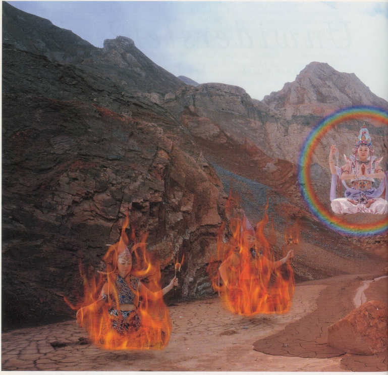
MARIKO MORI, BURNING DESIRE, 1996-98, color photograph on glass, 10' x 20' x 13/16", 5 panels, each 4' wide /