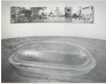
MARIKO MORI, BODY CAPSULE, 1995, and BEGINNING OF THE END, SHIBUYA, TOKYO, 1995, installation view at Deitch Projects, New York / KÖRPERKAPSEL und ANFANG VOM ENDE, SHIBUYA, TOKIO.

hegt: Es ist von entscheidender Bedeutung, dass nicht der geringste Hauch eines Misstons, einer gesellschaftlichen oder seelischen Unruhe die erhabenen Gleitbewegungen der techno-imaginären Maschinerie stört. Die Neutralisation der Sexualität ist dabei von höchster Wichtigkeit. Wohl gemerkt, nicht die Unterdrückung der Sexualität: Da ist nichts Strenges oder Puritanisches an der Triebökonomie, die Mori in ihren Werken vorführt. Im Gegenteil, es ist wichtig, dass die sexuelle Energie innerhalb des visuellen Systems frei zirkulieren kann. Aber sie muss leidenschaftslos bleiben: eine Sexualität ohne vulgären Ausdruck oder Risiko und ohne grosse Tristan- und Isolde-Momente; eine Sexualität, die unauffällig auf das Kindliche zudrückt, in der kindlich gleichbedeutend ist mit unwiderstehlich. Es ist interessant, dass Moris Bildsprache gerade in der westlichen Unterscheidung von prä-sexueller Kindheit und Adoleszenz oder Erwachsenenalter, wo die Sexualität für das im Subjekt verbliebene Rebelle und Wilde steht, ein Störungspotential ausmacht. Moris Bildsprache löst diesen Gegensatz auf: Sie sexualisiert das Kind, während sie den Erwachsenen infantilisiert. Moris Verkörperungen weiblicher Sexualität halten hartnäckig an einer Kinderzimmerwelt der Pastellfarben und runden Schmusformen fest: Barbarella und Bardot müssen My Little Pony weichen. 3)