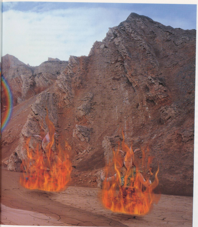
BRENNENDE SEHNSUCHT, Farbphotographie auf Glas, 305 x 610 x 2,2 cm, 5 Tafeln, je 122 cm breit.