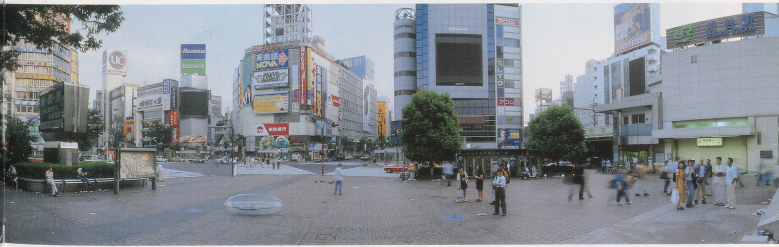
MARIKO MORI, BEGINNING OF THE END, SHIBUYA, TOKYO, 1995, crystal print, wood, pewter frame, 39" x 16" 5" x 3" / ANFANG VOM ENDE, SHIBUYA, TOKIO, Crystal-Print, Holz, Zinnrahmen, 100 x 500 x 7,6 cm.