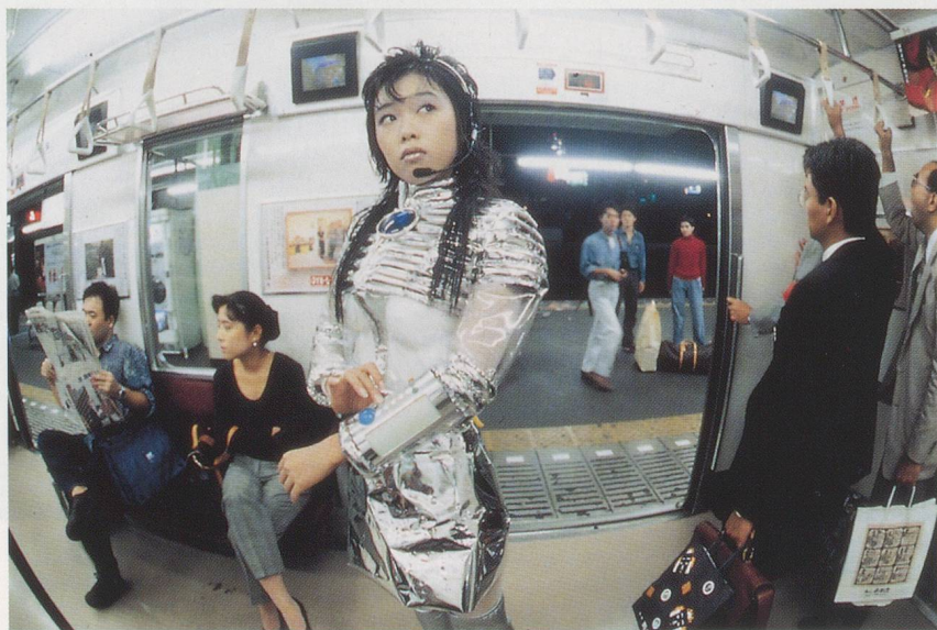
MARIKO MORI, SUBWAY , 1994, super gloss Duraflex print, wood, pewter frame, 27 x 40 x 2" / U-BAHN, Hochglanz-Duraflex-Print, Holz, Zinnrahmen, 68,6 x 101,6 x 5,1 cm.

Dass es Mori's Absicht ist, mit den durch die gegenwärtige Bilderflut in Gang gesetzten Kräften zu wetteifern oder diese zu übertreffen, wird wie ich glaube durch ein gewisses Unbehagen bestätigt, das ihre Bilder beim Betrachter auszulösen imstande sind – als hätte sie die Zugeständnisse an die Bilderflut allzu weit getrieben. Man hält laufend Ausschau nach Zeichen kritischen Bewusstseins, als würden sie uns vor dem schrecklichen Schicksal bewahren können, tatsächlich schutzlos in die Bilderflut getaucht zu werden, wie auf der grauenhaften Fahrt durch einen Vergnügungspark, wo es kein Entrinnen gibt, während Galaxien und Planeten vorbeirasen und einem zunehmend übel wird. Tatsächlich findet man solche Zeichen kritischen Bewusstseins, besonders in Mori's Arbeiten der frühen 90er Jahre, die in der Regel eine der Bilderflut entsprungene Kreatur zeigen, die plötzlich in der realen Welt auftaucht: in einem U-Bahn-Waggon, einem Spielsalon, einem Bürogebäude. Diese Arbeiten tun ihre kritische Botschaft laut und deutlich kund: Man sieht genau, wo und wie sich das psychische Verhängtsein in der Bilderflut ins grössere sozioökonomische Bild fügt. Die Figuren der futuristischen Gestalt in SUBWAY (U-Bahn), des unwiderstehlichen Sailor Moon-Girls 1) in PLAY WITH ME (Spiel mit mir) und der feenhaften Bürodame in TEA CEREMONY III (Teezeremonie III) sind direkt aus ihrem jeweiligen gesellschaftlichen