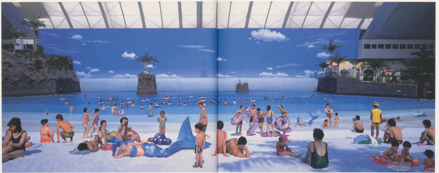
MARIKO MORI, EMPTY DREAM , 1995. c-print, aluminum, wood, smoked chrome aluminum frame, 9' x 24' x 3" / LEERER TRAUM, C-Print, Aluminium, Holz, rauchschaars verchromter Aluminiumrahmen, 274 x 732 x 7,6 cm.

gy of distanciation and analysis than by impersonation: She uses her body as a lens that captures the light of the contemporary image-stream, and through certain enhancements and exaggerations makes it clear what the image-stream really wants of us. In the first place, it appears keen to eliminate any residual sense of the historical: Allusions to Mayan, Indian, Egyptian, Greek and Chinese art are laid out on the