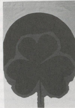
DESIGN: GARY HUME, TAPISserie, OHNE TITEL, 1998; Schuss: Kammgarne, Gobelingarne; Kette: Baumwolle, 258 Arbeitsstunden, 194 x 135 cm / TAPESTRY, UNTITLED, weft: yarn, gobelin yarn; warp: cotton; 258 hours of work, 76 1/8 x 53 1/8".

Susret ist das serbokroatische Wort für Begegnung und der Name einer aussergewöhnlichen Kunstmanufaktur aus Frastanz in Vorarlberg. Das Atelier geht auf ein einzigartiges Kunsttherapie- und Sozialprojekt für kriegstraumatisierte bosnische Frauen zurück. Talentierte Hände weben hier in Museumsqualität Teppiche, Tapisserien und textile Objekte nach Entwürfen renommierter internationaler Künstler und knüpfen damit an die Tradition der Webwerkstätten der Bauhaus-Gruppe und der Wiener Werkstätte an. Die Auflagen der zeitgenössischen Werke sind streng limitiert und werden vom Künstler zertifiziert. Ausstellungen in Europa, New York, Los Angeles. Sammlerobjekte. Ankäufe durch diverse Museen und Galerien.