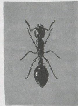
DESIGN: PETER KOGLER, KNÜPP-TEPPICH, OHNE TITEL, 1997, Schuss und Flor: Schurwolle; Kette: Baumwolle, 350 Arbeitsstunden, 280 x 200 cm / CARPET, UNTITLED, weft and pile: virgin wool; warp: cotton, 350 hours of work, 110 1/4 x 78 1/4".