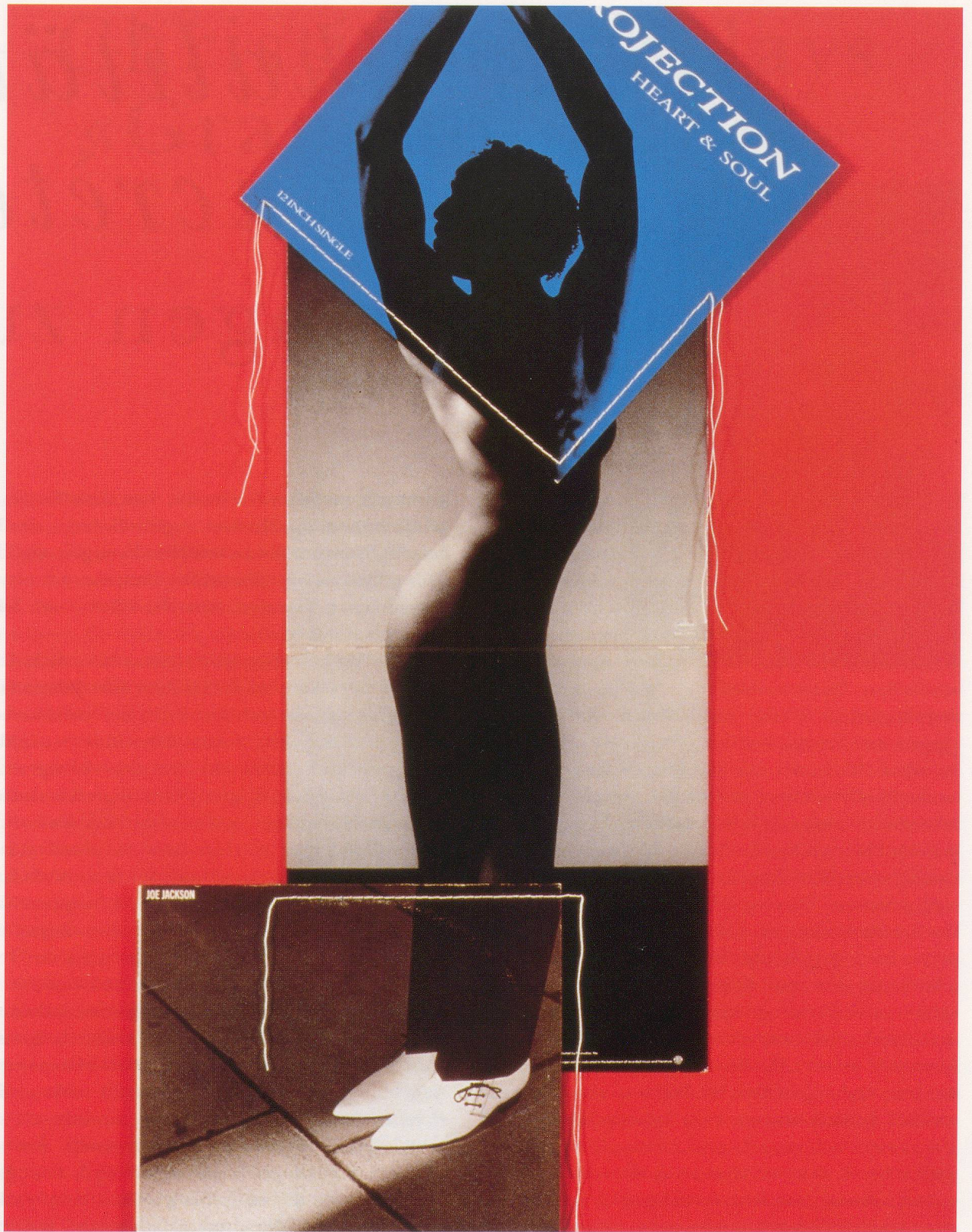
CHRISTIAN MARCLAY, LOOK SHARP, 1991, record covers and thread, 40½ x 20" / HEISS AUSSEHEN, Plattenhüllen und Bindfäden, 102,9 x 50,8 cm.