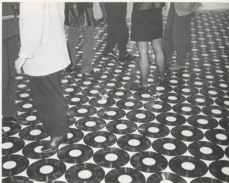
CHRISTIAN MARCLAY, FOOTSTEPS , 1989, 3500 vinyl records, installation, Shedhalle Zurich / SCHRITTE , 3500 Vinylschallplatten.

his "live" and his artefactual practices as performative presentations of the central semiotic signature of gramophonic inscription—that is the index.