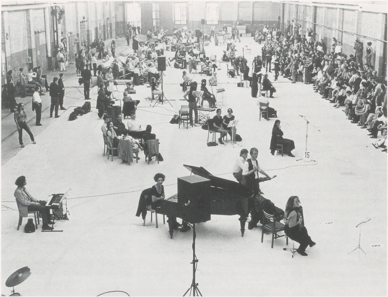
CHRISTIAN MARCLAY, BERLIN MIX , 1993, performance / BERLINER MIX , Performance im Strassenbahndepot, Berlin.

wollten, wie es klingt, wenn man eine Platte zerbricht, werden fasziniert sein von dem enormen Reichtum an rhythmischen, beinahe schon fugenähnlichen Beispielen dieser transgressiven Geste, die den dramatischen Höhepunkt der Performance darstellt. Weniger augenfällig ist, dass diese Geste, wenn auch unter strikteren Bedingungen, jene der Produktionsweise von Marclays Serie der Recycled Records (Rezyklierten Platten) aus den frühen 80er Jahren ist. Es handelt sich dabei um phonographische Montagen aus zerbrochenen und anschließend sorgfältig zurechtgeschnittenen und zu einem mosaikartigen Ganzen zusammengeklebten Platten. Auf eine Art, die an Milan Knizaks in den 50er Jahren angewandte Fluxus-Methoden erinnert, an das Versengen, Zerkratzen, Bemalen, Zerschneiden und Zusammenset-