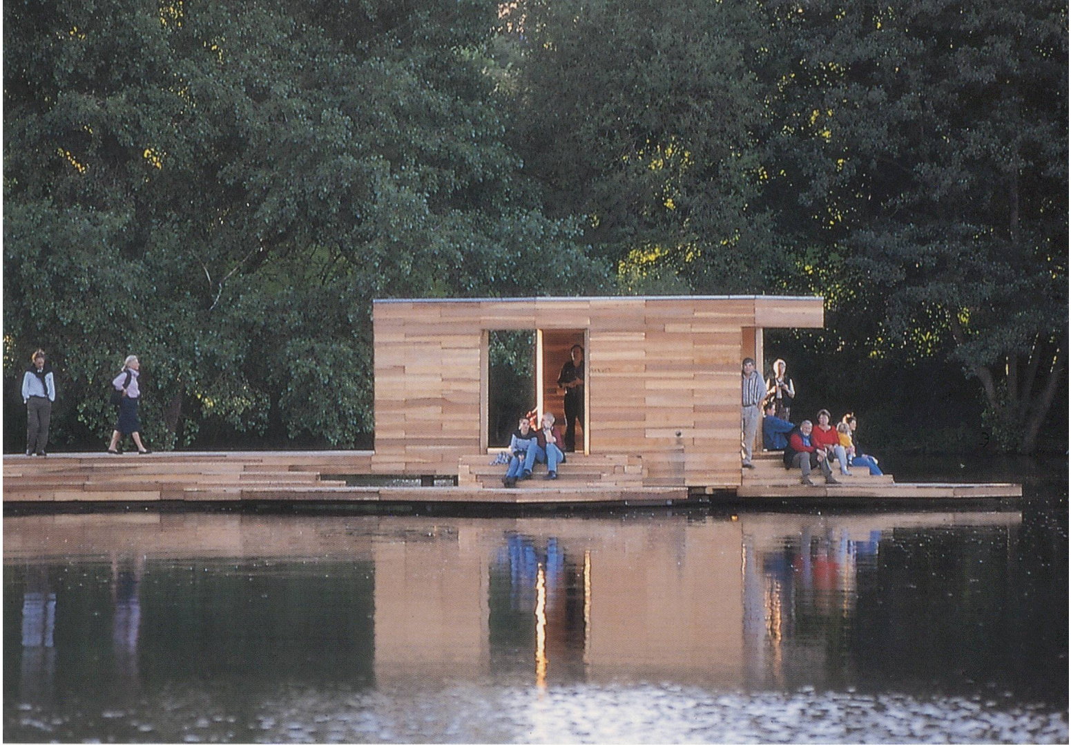
JORGE PARDO, PIER, 1997, redwood, metal, cigarette vending machine, installation view, "Skulptur. Projekte Münster" / Rotholz, Metall, Zigarettenselbstautomat.

Raum blieb offen und leer. Die Ausstellung bestand also vor allem aus Licht und Raum und erwies damit dem über lange Jahre wohl bekanntesten in Los Angeles entstandenen Trend seine Referenz. Licht war seit jeher Pardos Thema gewesen. Bei den handgeblasenen Lampen, die er nach wie vor entwirft, geht die Auffassung des Lichts als taktiles Element – ein für die Arbeiten von Robert Irwin oder James Turrell charakteristisches Konzept – Hand in Hand mit der Konstruktion eines modernen, farbenfrohen häuslichen Environments, das an Charles und Ray Eames, zwei weitere Designklassiker aus L. A., erinnert. Als Pardo sein eigenes Haus für das Publikum öffnete, füllte er das tiefer gelegene Atelier mit Lampen, die er für das Boijmans Van Beuningen Museum