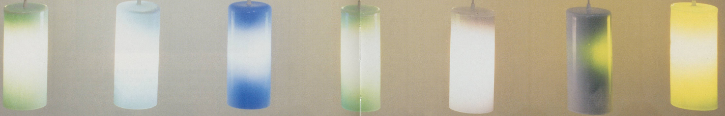
JORGE PARDO, UNTITLED, 1996, 7 glass lamps, 12 x 5 inch / OBIEN TITEL, 7 Glöslampen, 30,5 x 12,7 cm.