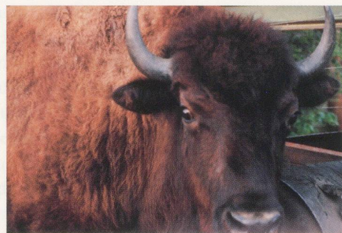
RED BUFFALO, June 1995 / ROTER BÜFFEL.