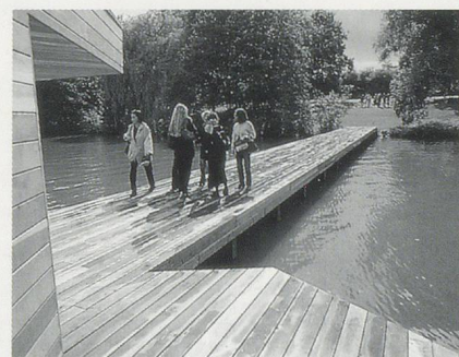
JORGE PARDO, PIER, 1997, redwood, metal, cigarette vending machine, installation view, "Skulptur. Projekte Münster" / Rotholz, Metall, Zigarettensautomat.