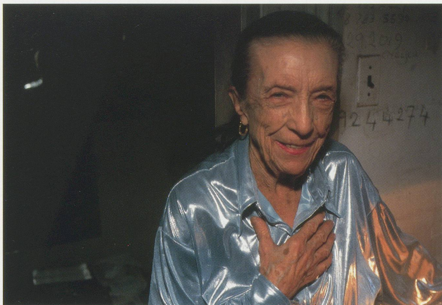
NAN GOLDIN, LOUISE BOURGEOIS, NEW YORK, 1998.

Of the faces she has recently photographed she says, “Yes, they’re looking into themselves. I’ve become really interested in how close you can come to another human being, to see out of their eyes, to really understand what it is to be another person. For me that’s the real frustration, the boundary you can never pass.” 3) This will to empathy no doubt explains her affinity for the art of Barnett Newman or Mark Rothko, painting “shining forth,” to cite the title of a Newman work ( SHINING FORTH, TO GEORGE , 1961), a dazzling visual experience that produces the sensation of being entirely and wholly focused or suspended in confrontation with colored surface, its ruptures and passages converging on one unique and singular event.