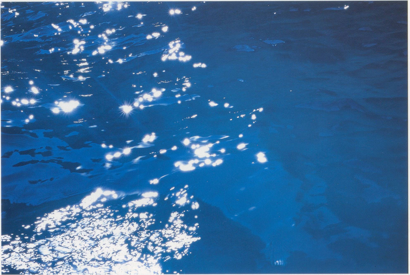
NAN GOLDIN, SEA AT CAPRI, ITALY, 1997 / MEER BEI CAPRI, ITALIEN.