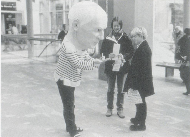
MAURIZIO CATTELAN, UNTITLED, 1998, project no. 65, mask, paint, costume, The Museum of Modern Art, New York / OHNE TITEL, Projekt Nr. 65, Maske, Farbe, Kostüm.

chem sie Cattelan mit gehässigen Worten als Clown und Zyniker in einem charakterisierte. Das Fehlen jeglicher Ausstellung von Werken und jeder öffentlichen Diskussion unter den Künstlern hatte die Attacke provoziert. Liu schreibt: