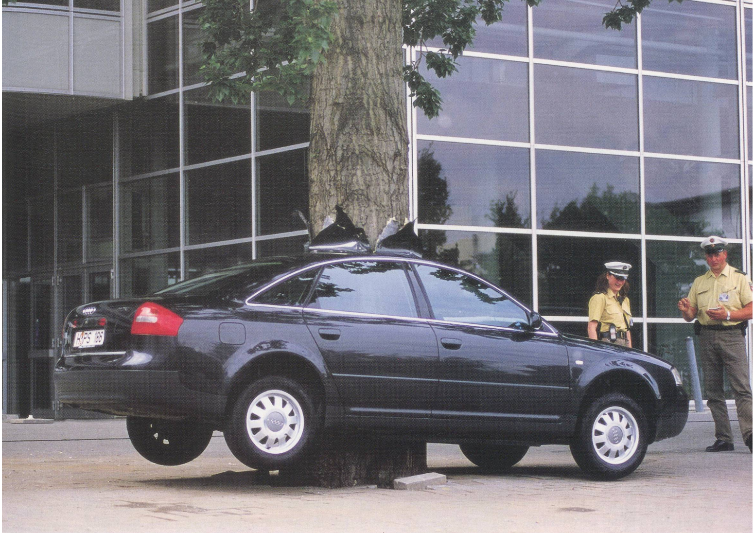
MAURIZIO CATTELAN, UNTITLED , 2000, car installation at the Expo Hannover / OHNE TITEL.

tion of European saints and pilgrims. For them, art is a coded language that allows for communication with different species: Their audience is more like St. Francis's birds than Studio 54's paparazzi. Yet never have two artists been more dissimilar from each other—one a shaman and the other a street actor and, like these characters, both sharing a fantastic amount of hypocrisy. They fight, at different levels, the formal narrative of contemporary art, and yet over and over again they are able to create sculptural visions. Their ability is in transforming revolutionary and iconoclastic energy into pure art works, while