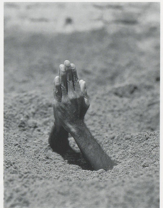
MAURIZIO CATTELAN, MOTHER , 1999, fakir buried in earth , Venice Biennale / MUTTER, in Erde vergrabener Fakir , Biennale Venedig.