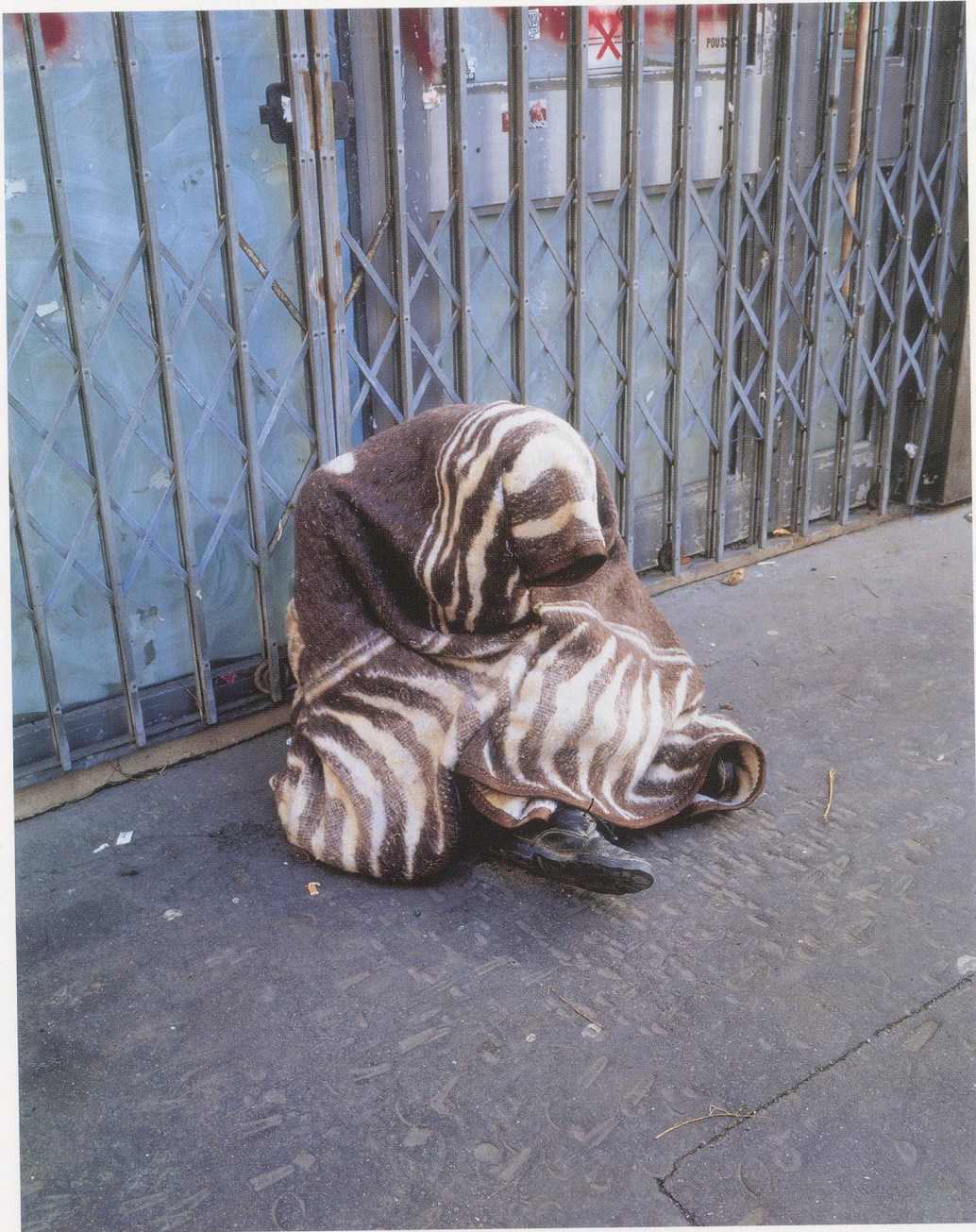
MAURIZIO CATTELAN, UNTITLED (GÉRARD), 1999, lifesize plastic dummy, clothes, shoes / OHNE TITEL (GÉRARD), Plastikpuppe, Kleider, Schuhe.