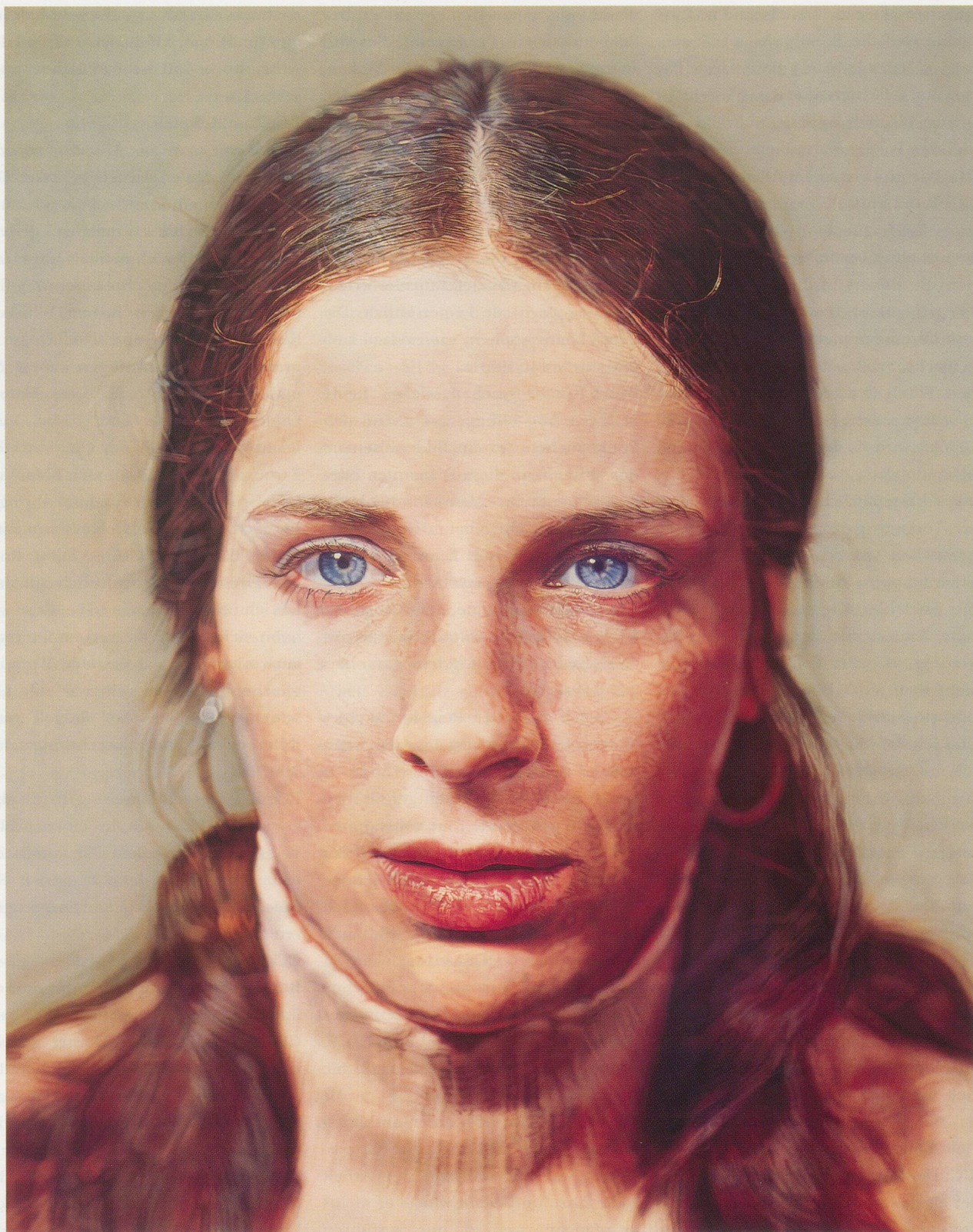
CHUCK CLOSE, LESLIE, 1973, watercolor on paper on canvas, 72½ x 57" / Aquarell auf Papier auf Leinwand, 184,2 x 144,8 cm.