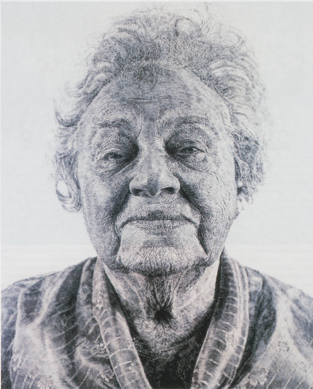
CHUCK CLOSE, FANNY / FINGERPAINTING, 1985, oil on canvas, 102 x 84" / Öl auf Leinwand, 259 x 213 cm.