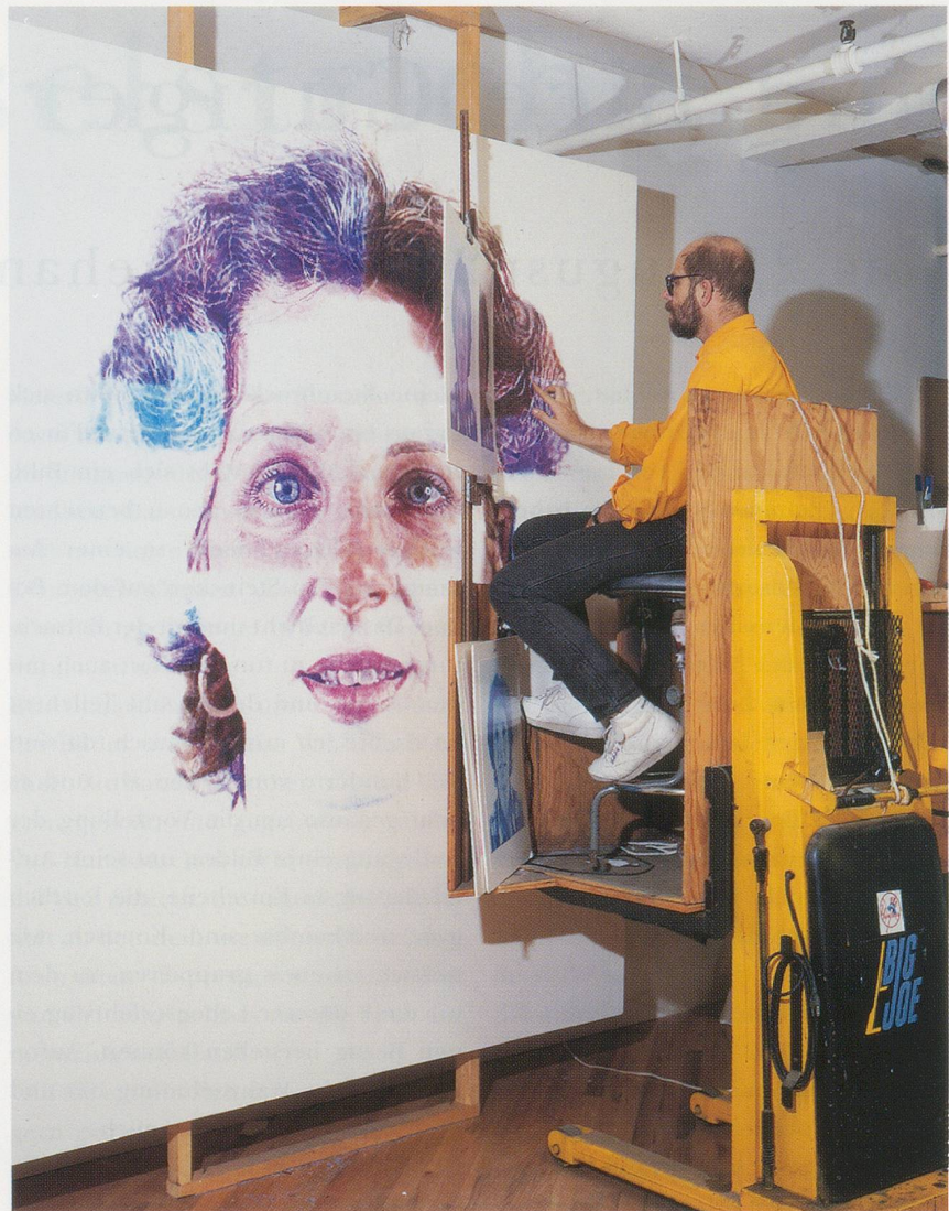
CHUCK CLOSE, LESLIE / FINGERPAINTING, 1985, oil based ink on canvas, 102 x 84", the artist with work in progress / Tusche auf Ölbasis auf Leinwand, 259,1 x 213,4 cm, in Arbeit.

BC: Auf einen bestimmten historischen Moment zurückschauend, denke