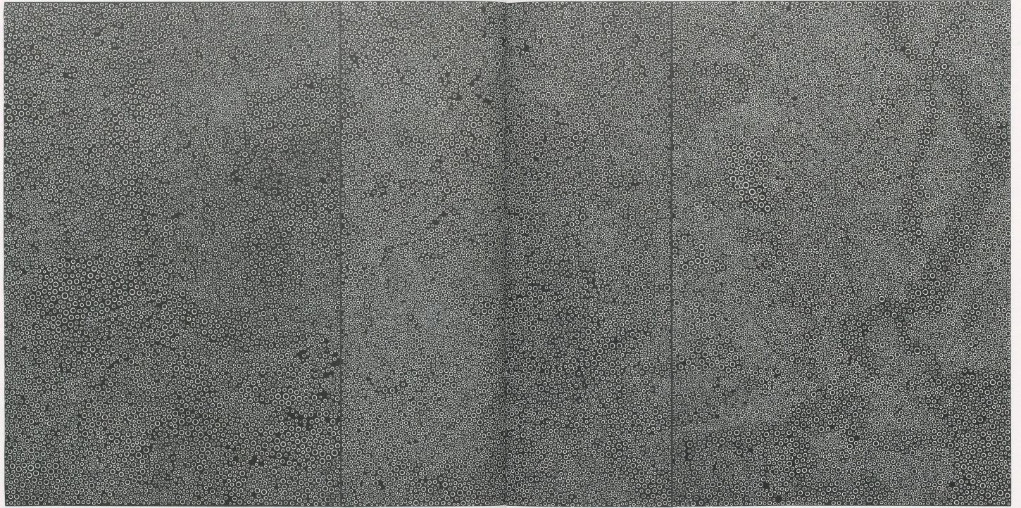
YAYOI KUSAMA, THE GALAXY AQ , 1993, acrylic on canvas, triptych, 76 3/4 x 51 3/4" each panel / YAYOI KUSAMA, DIE GALAXIE AQ , Acryl auf Leinwand, Triptychon, jede Tafel 194 x 130 cm.