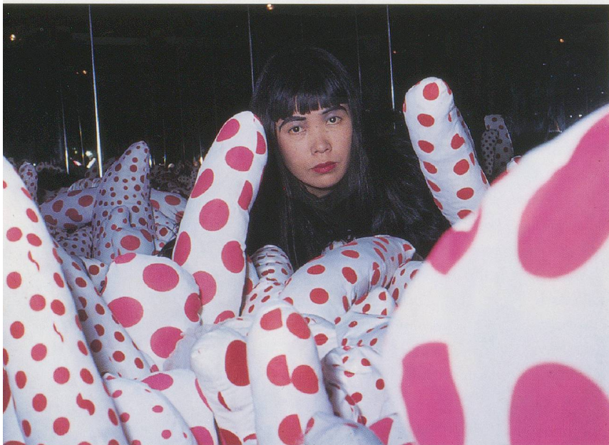
YAYOI KUSAMA, PHALLI'S FIELD, 1964, floor show at Castellane Gallery, New York / PHALLENFELD.

Many aspects of Kusama’s productivity show affinity with this definition of “schizophrenia”: the mechanical distribution of discrete dots in INFINITY NETS that does not suggest an external organizational code or a structural system, but still demonstrates a powerful physical presence. She achieves a