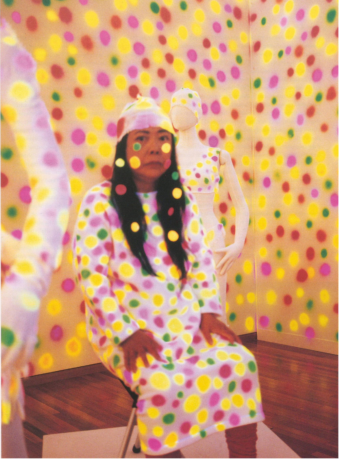
YAYOI KUSAMA, POLKA DOT INSTALLATION AND PERFORMANCE, 1999, collaboration with Issay Miyake, Museum of Contemporary Art, Tokyo.