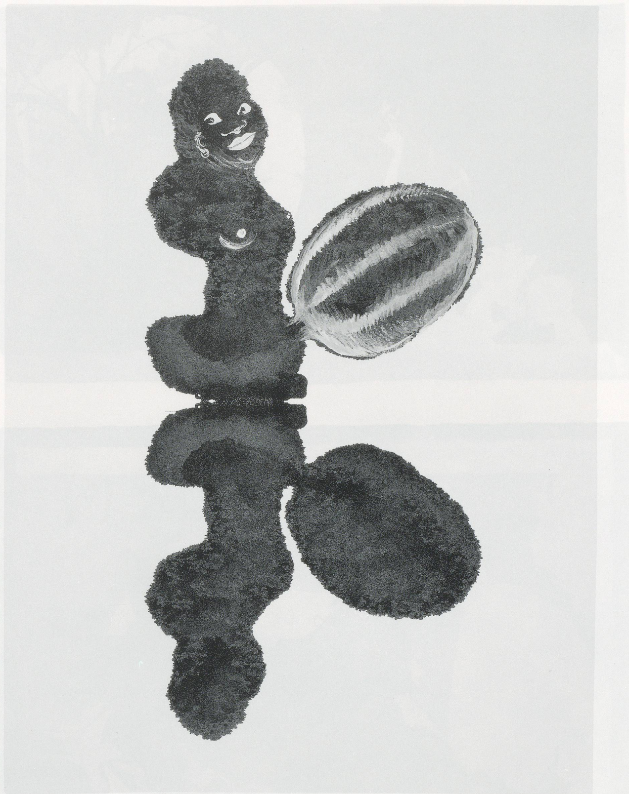
KARA WALKER, UNTITLED, 1995,

ink and gouache on paper, 12 x 8 3 / 4 " / OHNE TITEL, Tusche und Gouache auf Papier, 30,5 x 22,2 cm.