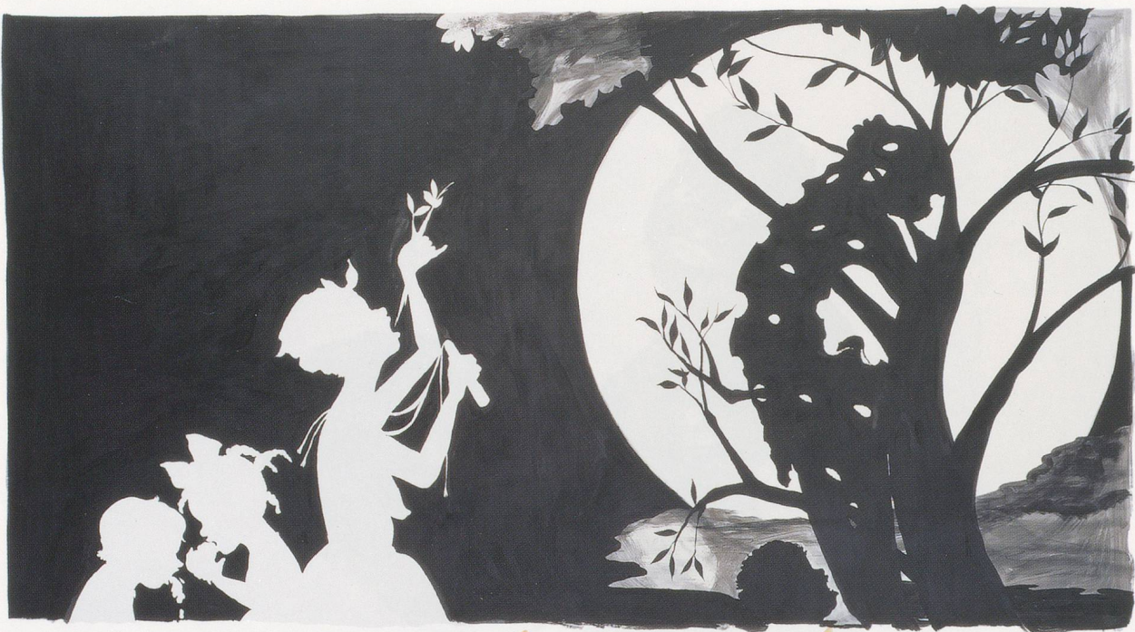
KARA WALKER, MASTER AND SLAVE TOGETHER—BUILDING A MODEL FOR THE FUTURE, 1998, white paint on paper, 65 x 95" / HERR UND SKLAVIN MITTEINANDER – BAU EINES MODELLS FÜR DIE ZUKUNFT, weiße Farbe auf Papier, 165,1 x 241,3 cm.