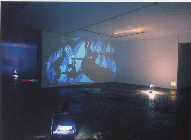
Bottom / Unten: MYSTERS DEMAND A SWEET AND DRAMATIC EMPYRICAL REACTION WHICH WE OBLIGED HIM, 2006, cut paper, adhesive, and projections on 2 walls, ca. 12 x 22 ft. wall / DIE HEHRIN WUNSCHTE EINE SÜSSE UND DRAMATISCH NACHGEBILDETE REAKTION. EIN MYSTICAL ROMAN VON MICHAKAMEN, Szenenschnitte und Projektionen auf 2 Wänden, 3,5 x 6,62 m. (PROJEKT: CENTRE D'ART CONTEMPORAIN, GENÈVE)