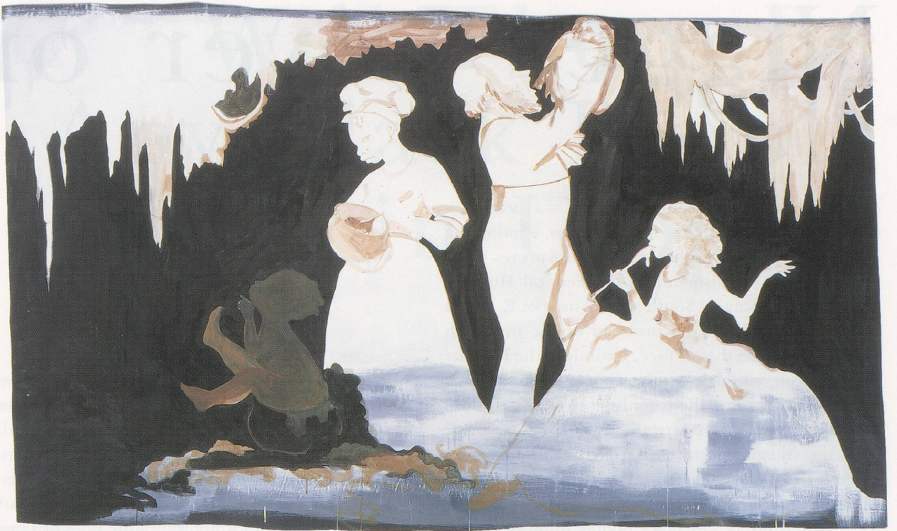
KARA WALKER, A GIVING GESTURE—MONUMENT TO THE NEW SOUTH (STUDY), 1998, gouache on paper, 66¼ x 106½" / EINE HINGEBUNGSVOLLE HAFTUNG – DENKMAL FÜR DEN NEUEN SÜDEN (STUDIE), Gouache auf Papier, 168,3 x 270,5 cm.