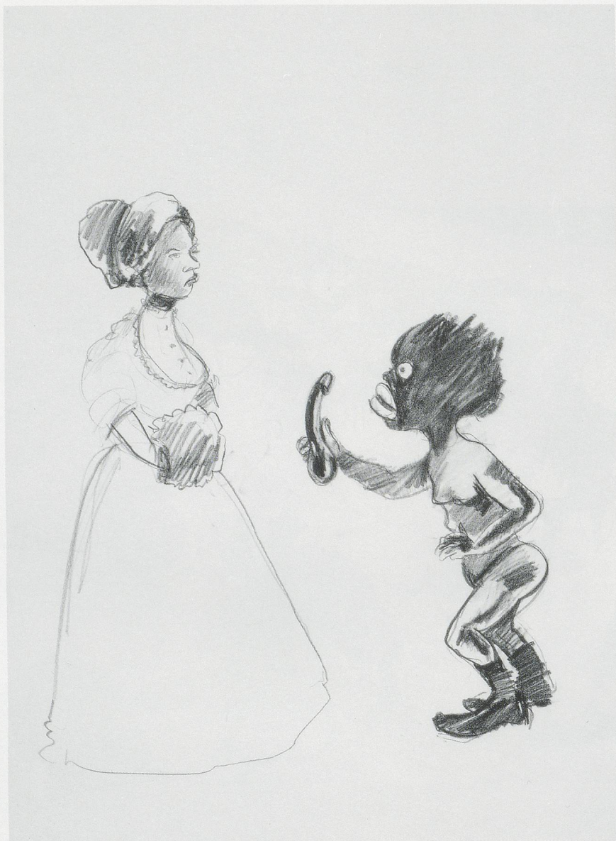
KARA WALKER, UNTITLED, 1995, charcoal on paper, 24 x 18" / OHNE TITEL, Kohle auf Papier, 61 x 45,7 cm.