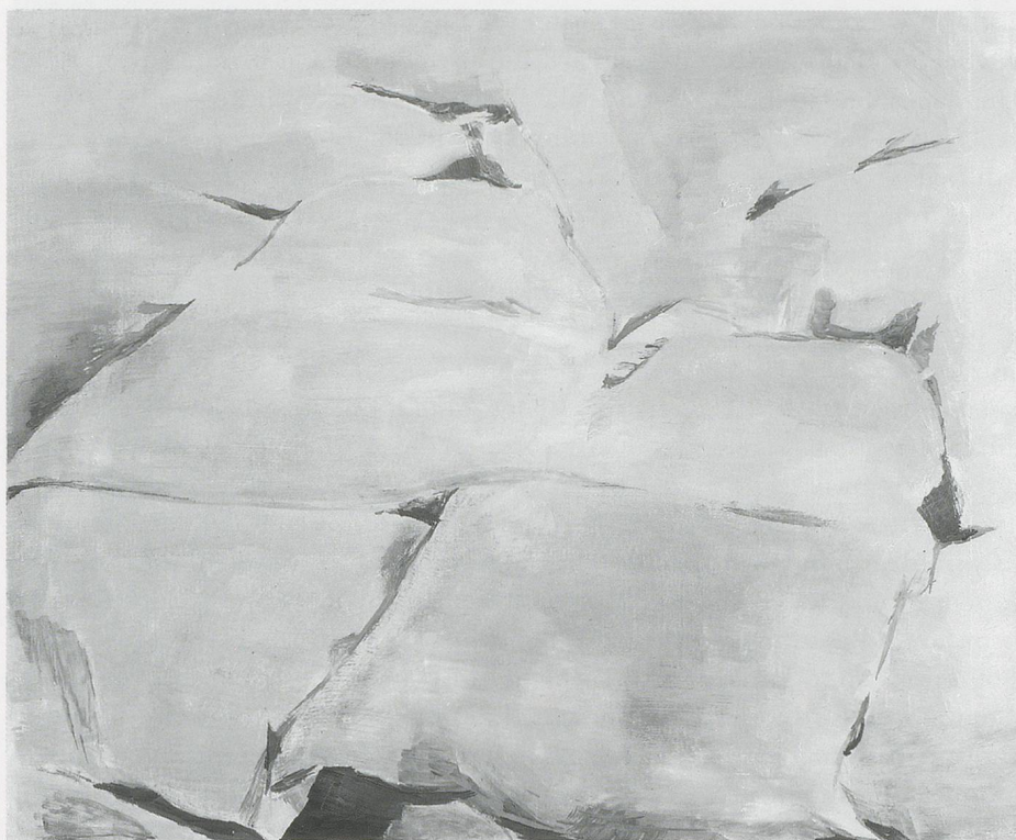
LUC TUYMANS, PILLOWS , 1994, oil on canvas, 21½ x 26¾" / KISSEN , Öl auf Leinwand, 54,5 x 67 cm.

small gap between the explanation of a picture and a picture itself provides the only possible perspective on painting. My comments refer only to its ambiguity." 1)