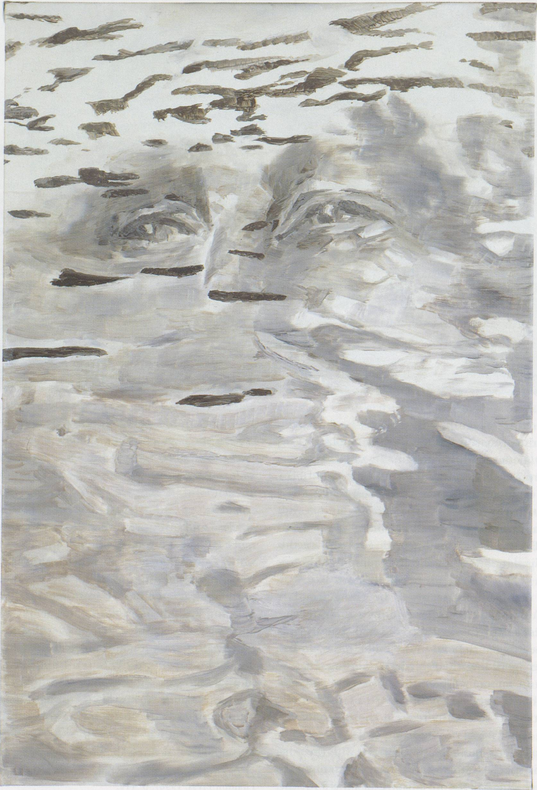
LUC TUYMANS, RESENTIMENT, 1995, oil on canvas, 37¼ x 25" / RESENTIMENT, Öl auf Leinwand, 94,5 x 63,5 cm.