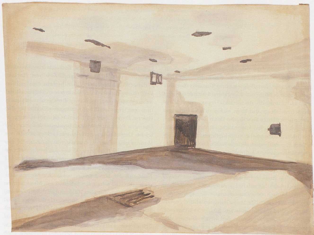
LUC TUYMANS, GAS CHAMBER, 1986,

oil on canvas, 19 7 / 8 x 27 1 / 2 " / GASKAMMER, Öl auf Leinwand, 50 x 70 cm.