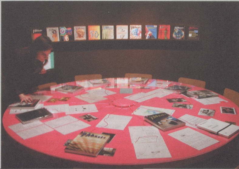
Exhibition view of reading table with Parkett issues and artists' correspondence