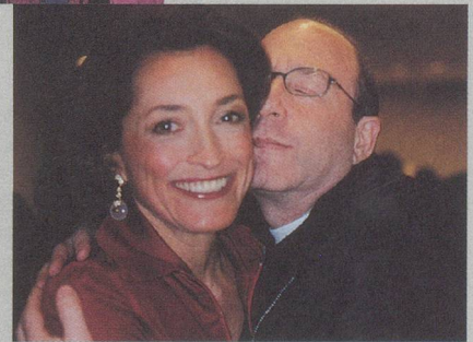
Diane Ackermann & Jerry Saltz

An agnostic from Zug once said, Parkett should never be read. Such an art magazine has gotta be seen, I wish I could take it to bed.