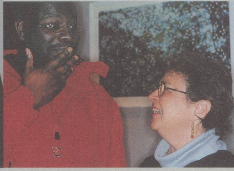
Steve McQueen & Marian Goodman