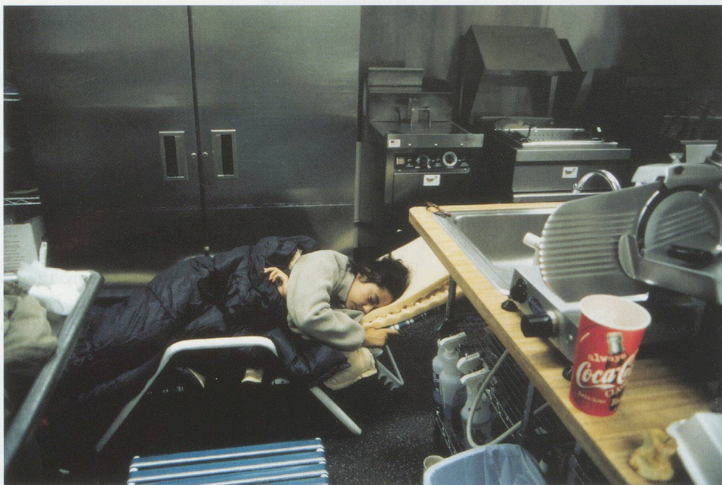
TACITA DEAN, DIXIE D'S SNACK BAR, HOONAH ALASKA , EARLY HOURS OF THE MORNING , 1999–2000, color photograph, 35 \frac{7}{8} x 39 \frac{7}{8} " / FRÜHMORGENS IN DIXIE D'S SNACK BAR, HOONAH ALASKA , Farbphoto, 90 x 100 cm.

stead, the protective metal chevrons that form the outer shell of the lantern pass repeatedly before our eyes. Beyond these geometric shapes, we view the vast expanse of sea, the sea where Crowhurst met his death. Although the lantern remains in perpetual motion, Dean chose to employ a static camera, rather than one that might further suggest the object's endless rotation. Such a technique initially offers the viewers the illusion that they are circling a stationary object, surrogates for the camera's eye. This, then, is the empowered viewer of the Renaissance. In actuality, however, the beholder is given a restricted view, one controlled by an unseen, external force, the inability to see beyond that which is given, forming a disturbing actuality. The viewer finds herself, therefore, immobilized, trapped, mes-