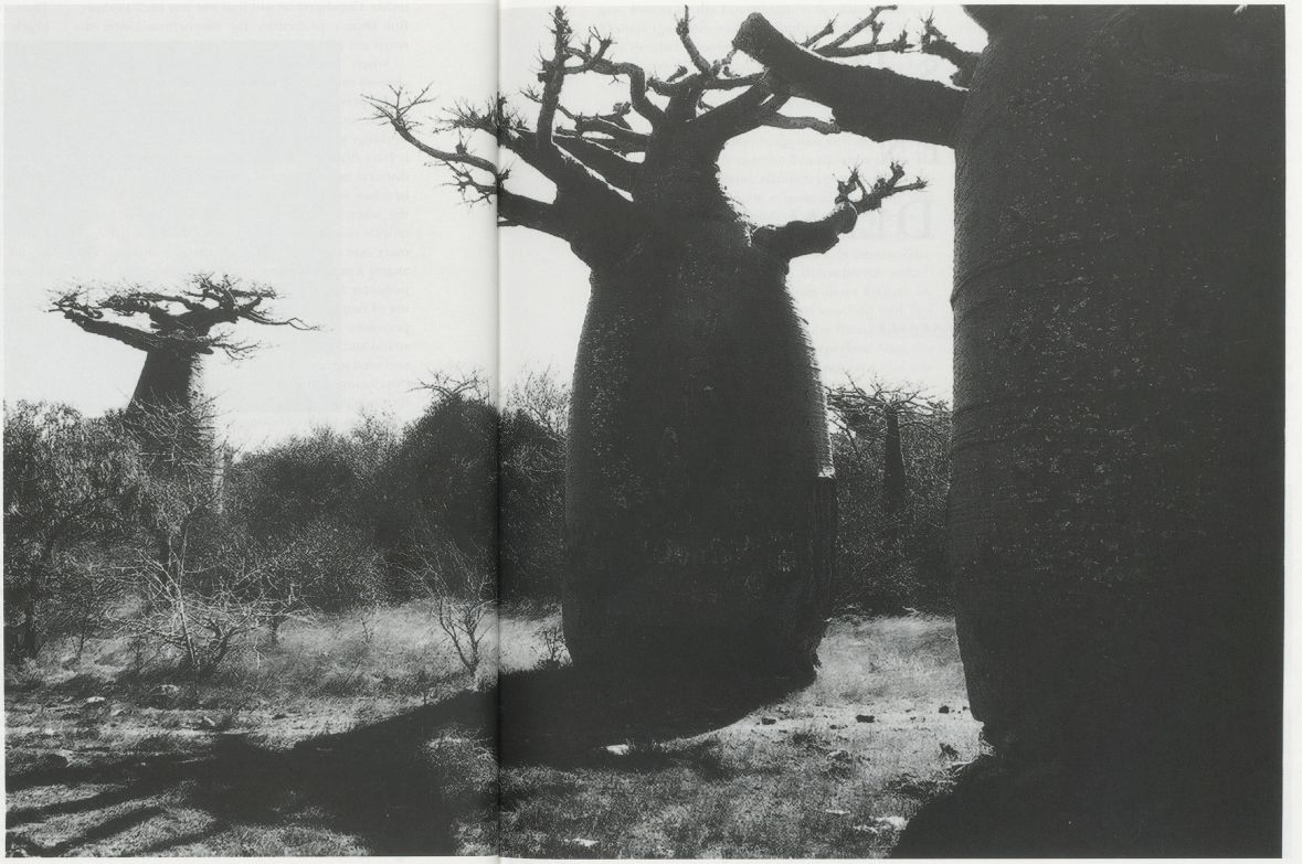
TACITA DEAN, BAOBAB, 2001, location photograph.