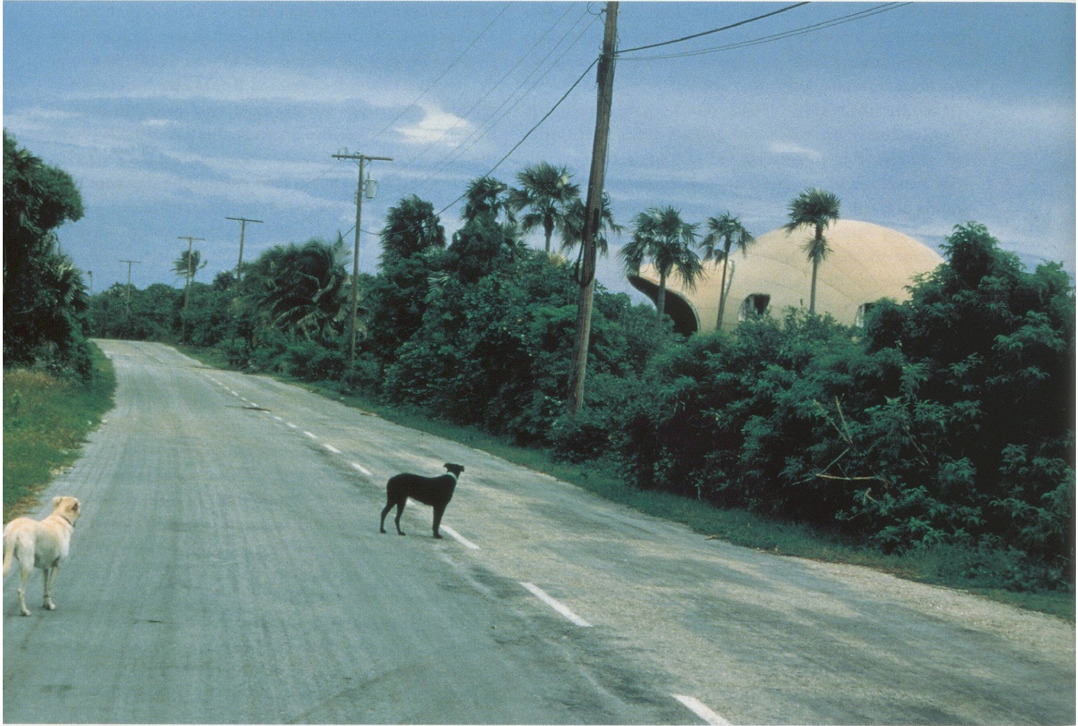
TACITA DEAN, BUBBLE HOUSE, 1999, color photograph, 23 \frac{3}{5} x 33" / Farbphoto, 59,5 x 84 cm.