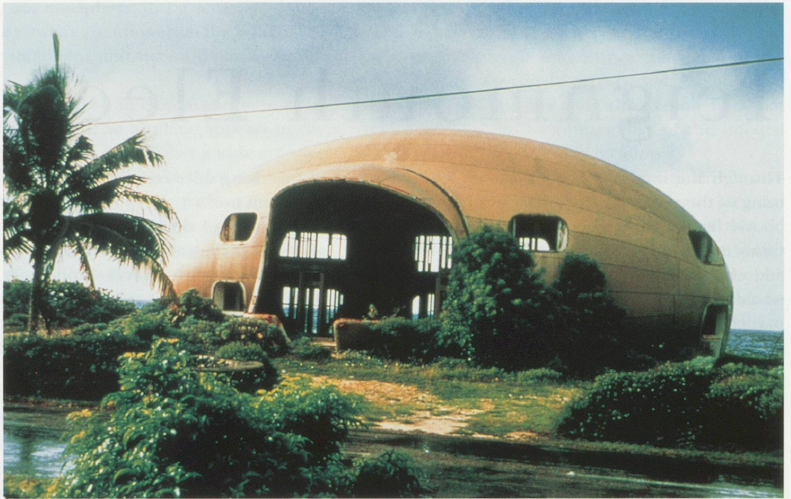
TACITA DEAN, BUBBLE HOUSE, 1999, color photograph, 39 x 58" / Farbphoto, 99 x 147,5 cm.