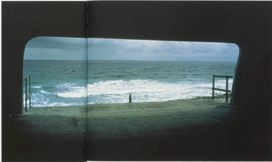
TACITA DEAN, BUBBLE HOUSE , 1999, color photograph, 23½ x 33" / Farbphoto, 59,5 x 84 cm.