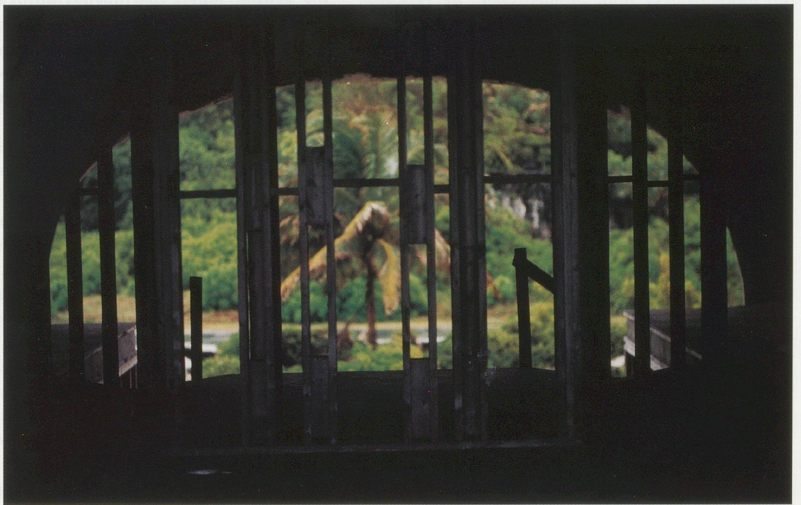
TACITA DEAN, BUBBLE HOUSE, CAYMAN BRAC, 1999, location photograph / Photographie am Drehort.