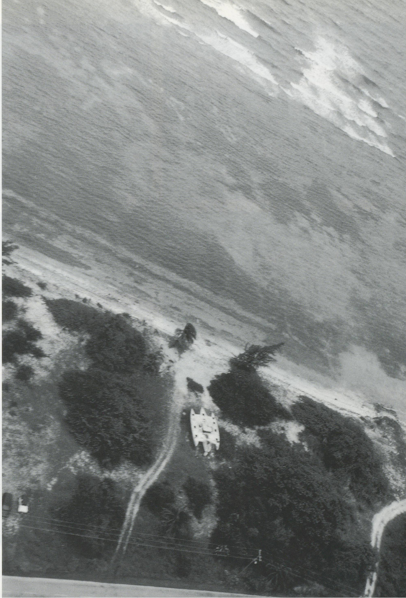
TACITA DEAN, TEIGNMOUTH ELECTRON, CAYMAN BRAC, 1999, black and white photograph, 39 7/8" x 26" / Schwarzweissphoto, 100 x 66 cm.