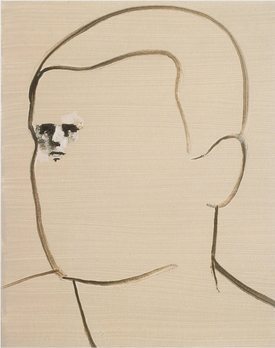
WILHELM SASNAL, UNTITLED, 2004, oil on canvas, 11 13 / 16 x 9 7 / 16 " / OHNE TITEL, Öl auf Leinwand, 30 x 24 cm.