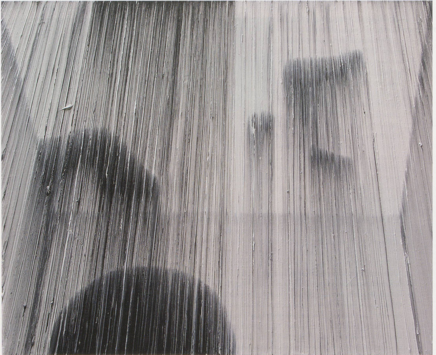
WILHELM SASNAL, UNTITLED (CHURCH), 2003, oil on canvas, 15 x 18 1/8" / OHNE TITEL (KIRCHE), Öl auf Leinwand, 38 x 46 cm.

Repräsentation kommt ins Schlingern, entwischt und bleibt in der Farbe stecken.