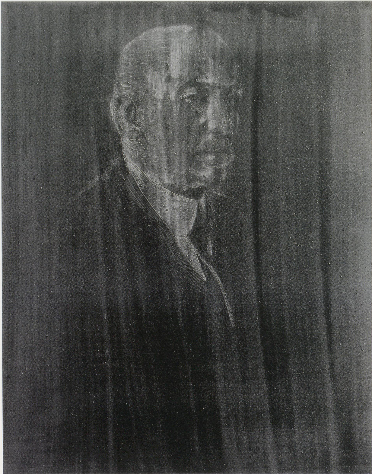
WILHELM SASNAL, NARUTOWICZ, 2003, oil on canvas, 19 1/16 x 15 3/4" / Öl auf Leinwand, 50 x 40 cm.