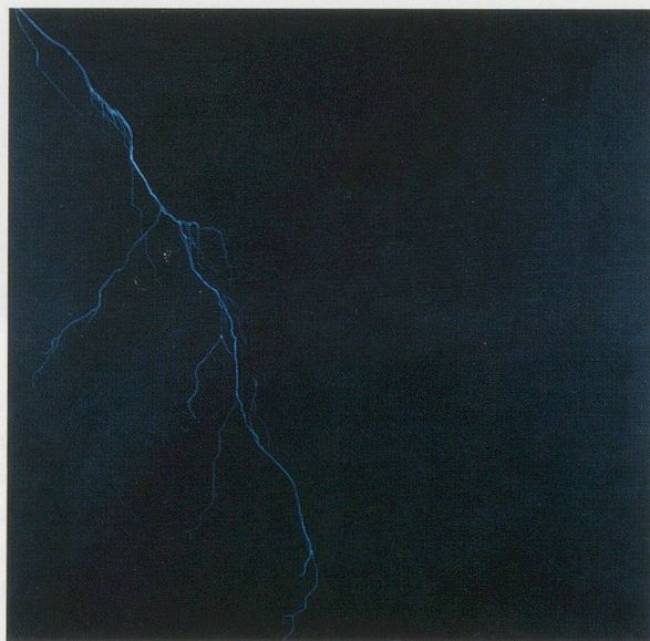
WILHELM SASNAL, UNTITLED, 2004, oil on canvas, 59 x 59" / OHNE TITEL, Öl auf Leinwand, 150 x 150 cm.

füllenden organischen Oberflächen, die völlig unlesbar und unpersönlich werden. Körper werden ebenso zu Handlungsschauplätzen, wie geographische Orte, Landschaften oder Gebäude. Gewöhnlich nimmt der Körper so viel Raum ein, dass er sich jeder Beschreibung entzieht: Die Person füllt das Bild aus, etwa in E. B. (2003) – die Sängerin Erykah Badu –, wo man nur eine riesige schwarze Wolke und daneben etwas Helleres sieht, vielleicht eine Afromähne und ein Hals. Zweifel stellen sich ein bezüglich der Überprüfbarkeit der Angaben, die ein Medienereignis ausmachen und schliesslich eine «historische Tatsache» schaffen, die uns gewöhnlich in Form einer Photographie, Fernsehaufzeichnung oder eines Diagramms erreicht. SADDAM'S BASEMENT, MY BASEMENT (2003) ist ein dunkles Loch, in dem man etwas erkennen kann, was die militärische Presseverlautbarung als Ventilator bezeichnet; das Bild zeigt aber eigentlich nur ein paar graue Flecken und einige verschmierte Linien. Gegenüber der Präzision des Titels wirkt die mangelhafte Genauigkeit und Glaubwürdigkeit des Bildes selbst schon fast komisch. Die