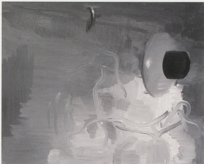
WILHELM SASNAL, SADDAM'S BASEMENT, MY BASEMENT, 2003, oil on canvas, 15 3/4 x 19 11/16" / SADDAMS KELLER, MEIN KELLER, Öl auf Leinwand, 40 x 50 cm.

füllenden organischen Oberflächen, die völlig unlesbar und unpersönlich werden. Körper werden ebenso zu Handlungsschauplätzen, wie geographische Orte, Landschaften oder Gebäude. Gewöhnlich nimmt der Körper so viel Raum ein, dass er sich jeder Beschreibung entzieht: Die Person füllt das Bild aus, etwa in E. B. (2003) – die Sängerin Erykah Badu –, wo man nur eine riesige schwarze Wolke und daneben etwas Helleres sieht, vielleicht eine Afromähne und ein Hals. Zweifel stellen sich ein bezüglich der Überprüfbarkeit der Angaben, die ein Medienereignis ausmachen und schliesslich eine «historische Tatsache» schaffen, die uns gewöhnlich in Form einer Photographie, Fernsehaufzeichnung oder eines Diagramms erreicht. SADDAM'S BASEMENT, MY BASEMENT (2003) ist ein dunkles Loch, in dem man etwas erkennen kann, was die militärische Presseverlautbarung als Ventilator bezeichnet; das Bild zeigt aber eigentlich nur ein paar graue Flecken und einige verschmierte Linien. Gegenüber der Präzision des Titels wirkt die mangelhafte Genauigkeit und Glaubwürdigkeit des Bildes selbst schon fast komisch. Die