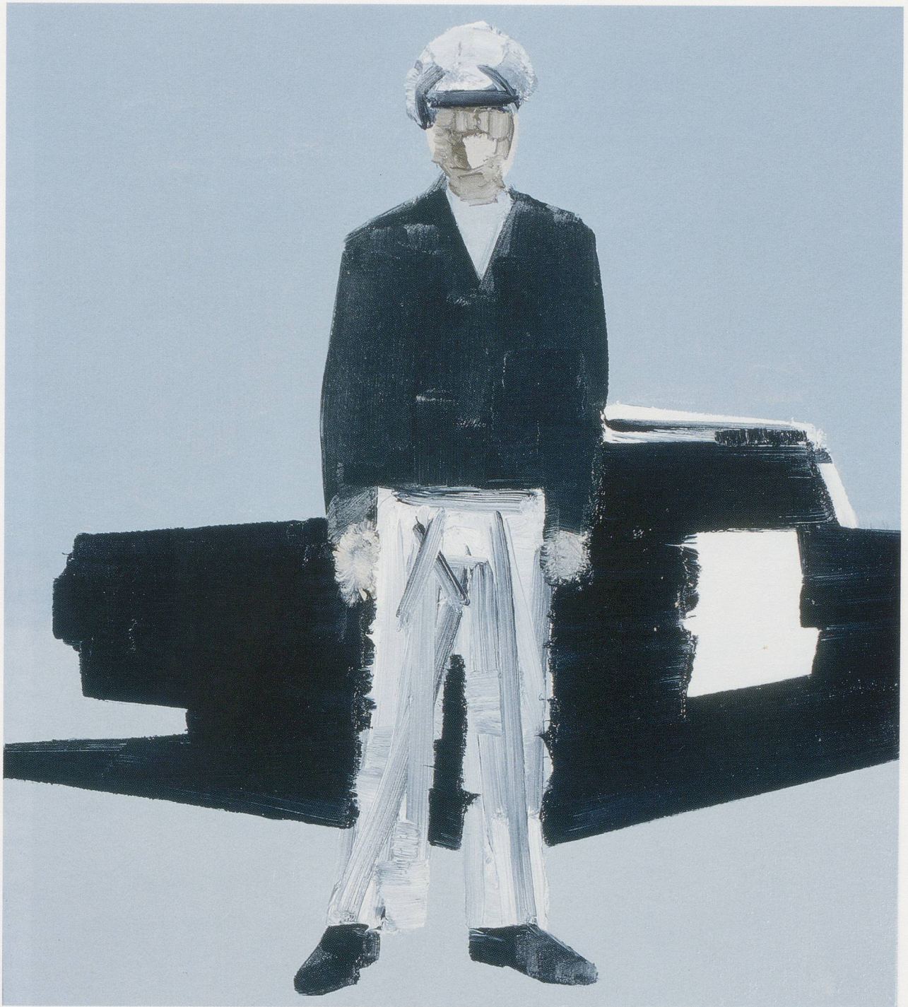
WILHELM SASNAL, UNTITLED, 2004, oil on canvas, 21 5 / 8 x 17 11 / 16 " / OHNE TITEL, Öl auf Leinwand, 55 x 45 cm.