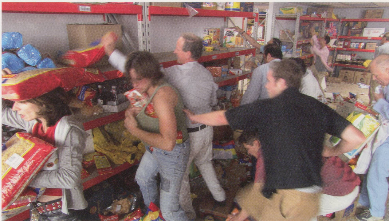
Left/Links: AERNOUT MIK, IN TWO MINDS, 2003, 55-minute live installation, coproduction with Toneelgroep and Stedelijk Museum, Amsterdam, installation view / VERUNSICHERT, 55-minütige Live-Installation, Momentaufnahme.