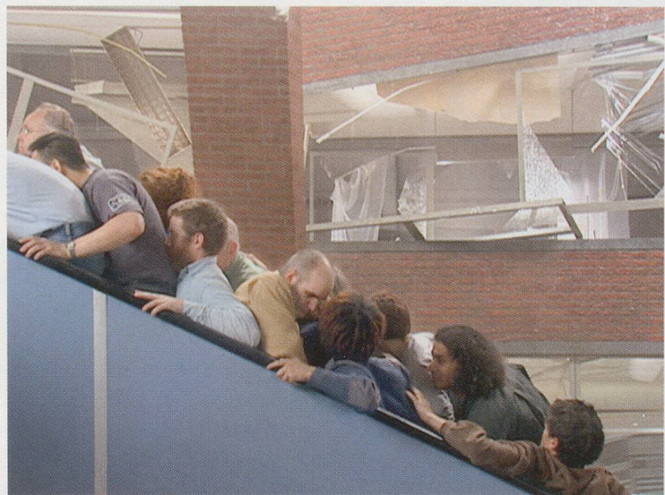
AERNOUT MIK, ORGANIC ESCALATOR , 2000, still from video installation, Galerie Gebauer, Berlin / ORGANISCHE ROLLTREPPE , Videostill.

Though it may sound a bit desperate, the regime of minor considerations has a more or less tranquilizing effect in the work of Aernout Mik. In Mik's