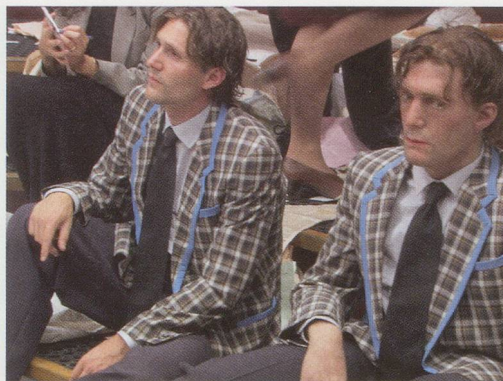
AERNOUT MIK, MIDDLEMEN , 2001, stills from video installation, Galerie Gebauer, Berlin / MITTELSMÄNNER , Videostills.

The supermarket is difficult to place. It could be a grocery store with marked-down lots of goods, perhaps in some "low-wage country," as they are called in the language of global capitalism. The airy clothing of those present suggests, in any case, a warm climate. Though supermarkets may be geared to local needs, they respond worldwide to a single order. Au-