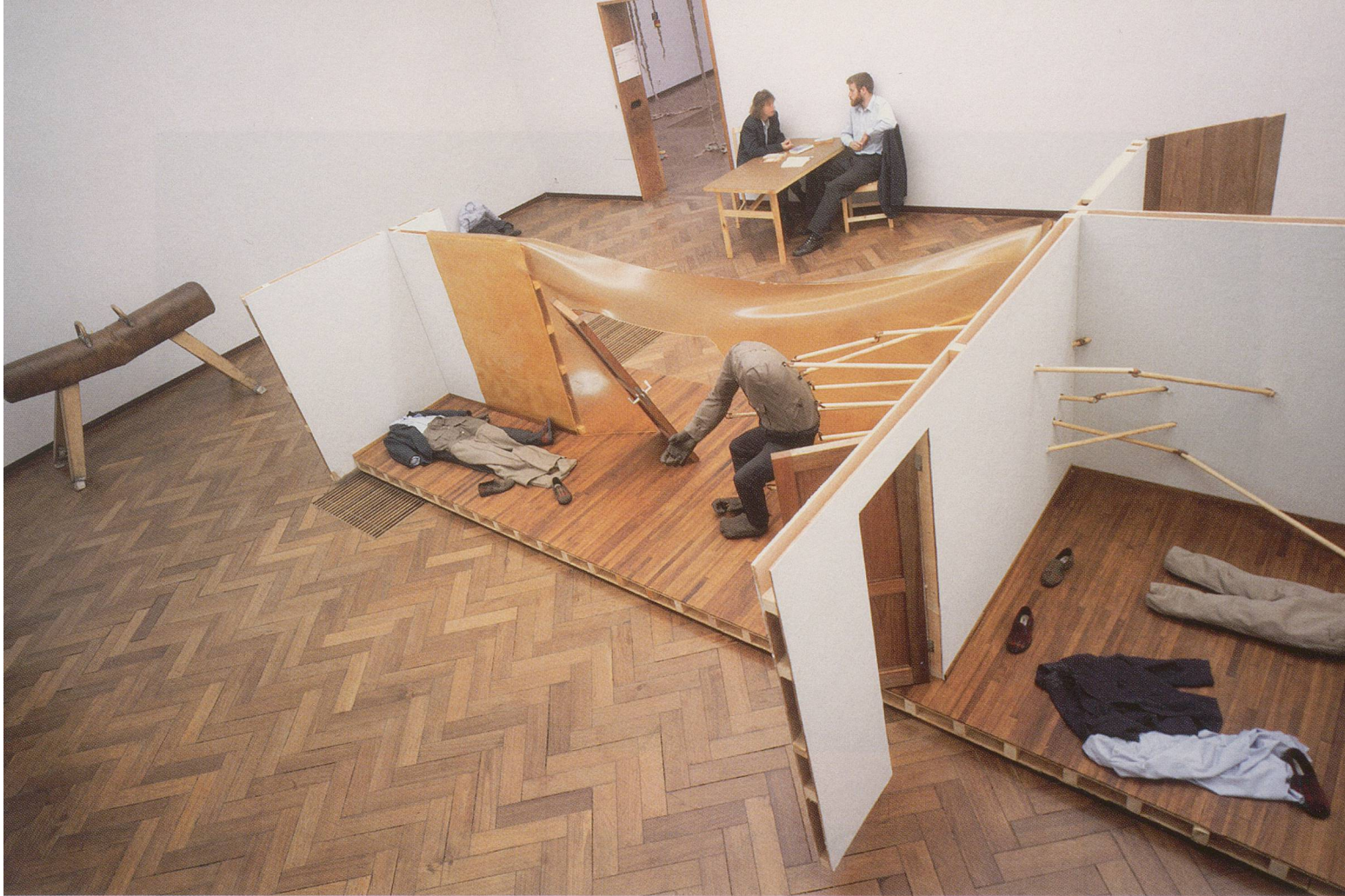
AERNOUT MIK, BLUE SINKHOLE , 1995, live installation at the exhibition "Wild Walls," Stedelijk Museum, Amsterdam / BLAUES SENKLOCH , Live-Installation in der Ausstellung «Wild Walls».

branch of global commerce, man survives on reflexes and automatisms, responding to some persistent, ruthless system. The derailments that we know from television images are stripped of their topical, social meaning. They have transformed into a ritual dance, a softly rocking tableau vivant that sharply conflicts with our notion of what is reasonable and sensible. Not only does the familiar supermarket resemble a wilderness; the subversive undermining of the consumer paradise—the stealing, plundering, squatting, destruction—has the effect of an anesthetic, as though no difference exists between the sight of an aquarium and television images of rebel-