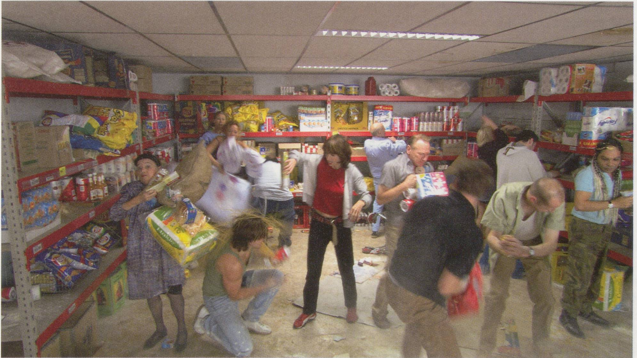
AERNOUT MIK, IN TWO MINDS , 2003, video stills from 55-minute live installation, coproduction with Toneelgroep and Stedelijk Museum, Amsterdam / VERUNSICHERT, Videostills aus der 55-minütigen Live-Installation.