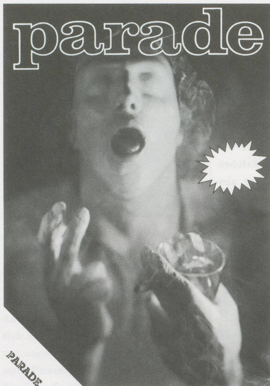
Cover of "Parade" Magazine / Titelblatt der Zeitschrift «Parade».

Leckey selbst: Er hält einen Schuh der Auslage in der Hand und streicht wie ein Fetischist über die glänzende Oberfläche. An früherer Stelle im Video steht eine Nahaufnahme von Leckey's matt wirkendem, mit Gel behandeltem Haar in scharfem Kontrast zur glatten Gesichtshaut makelloser Werbemodells. In der Einstellung mit dem Schuh wirkt die Haut des Künstlers selbst ähnlich verwundbar und real neben dem tiefen Glanz der verarbeiteten Tierhaut. Es ist, als würde durch das Reiben des Schuhs – das förmlich spürbare Knistern der beiden Oberflächen – ein Geist in der Lampe (beziehungsweise im Schuh) beschworen, was Leckey's äussere Gestalt übergangs-