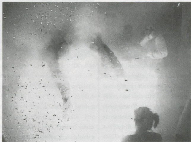
MARK LECKEY, WE ARE UNTITLED , 2001, still from 8-min. DVD /

But in the heart of the piece, Leckey inserts a shot of himself walking around what appears to be a cavernous church space. An artificially matched soundtrack of footsteps echoing on a stone floor adds an impression of spatial depth to the scene. The empty space and the sound delay force awareness of an alternative dimension, prompting consideration of what it means if, in order to be recognized, the individual must aspire to the condition of the inanimate image. In merging with the spectacle and becoming image, the artist-subject achieves the fantasy of transcendent abstraction, whilst inevitably becoming unobtainable to himself. This scenario makes the artist-subject ultra-visible, but leaves internal subjectivity to lurk in an imperceptible dimension. PARADE shows itself as a succession of seductive and beautiful images, but at its core, it is a lament.