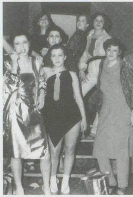
MARK LECKEY, FIORUCCI MADE ME Hardcore , 1999, still from 15-min. DVD / Bild aus der 15-minütigen DVD.

their attempts to transcend the obstinate physicality of the body and disappear in abstract identification with the ecstasy of music, or the seamlessness of the image.