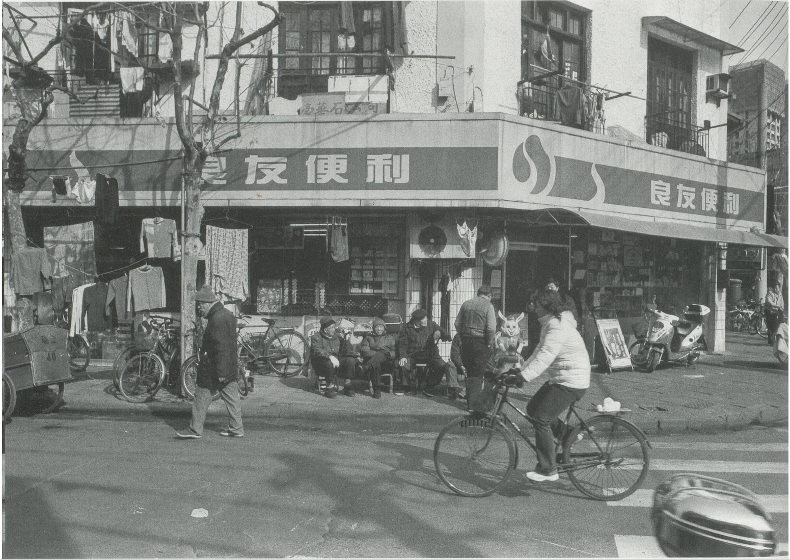
BALTHASAR BURKHARD, INSERT FOR PARKETT 75, 2005.