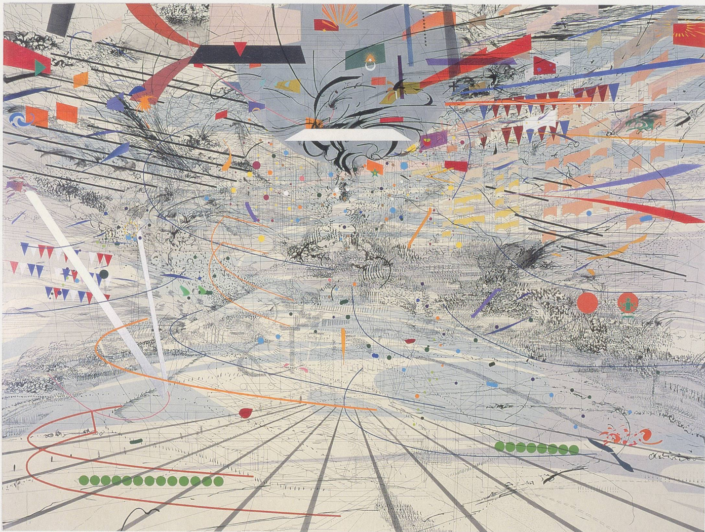
JULIE MEHRETU, CONGRESS, 2003, ink and acrylic on canvas, 70 x 102" / KONGRESS, Tusche und Acryl auf Leinwand, 178 cm x 260 cm.