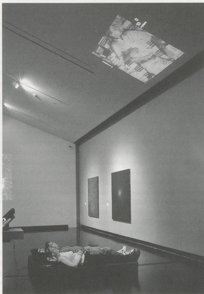
CHARLES AND RAY EAMES, POWERS OF TEN / KRAFTE HOCH ZEHN, 1977, installation view / Installationsansicht.

and the curators. The meeting was framed around three Grzimeks (performers armed with camera equipment), referring to Bernhard Grzimek, whose design for a modern zoo without bars evolved in the course of trying to salvage what was left of the Zoo after the war. Grzimek, who realized that citizens were more inclined to devote funds to support wild animals if they could see them up close, later founded the Serengeti Park in Tanzania. Yet, wild animals often do not want to be seen, and are especially skilled at remaining invisible. In the open environments Grzimek created, many displays