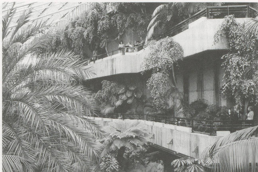
CERITH WYN EVANS, EAUX D'ARTIFICE , Barbican Art Gallery, London, 2005.

London ansässige Künstler aus Wales inszenierte im prächtigen und selten besuchten Wintergarten des Barbican Centers an vier aufeinander folgenden Sonntagnachmittagen eine künstlerische Intervention. An einem Sonntag versammelte der Künstler eine bunte Auswahl von Musikern im Garten, von Mitgliedern eines Gamelan-Ensembles bis zu Opernsängern, wobei alle gleichzeitig auftraten. Bei der zauberhaften Intervention, die ich selbst gesehen habe, waren an diversen versteckten Orten im Garten Fernrohre platziert. Beim Blick durch diese Fernrohre nahm man berausende visuelle Schichten der Wirklichkeit wahr: vage verschwimmende Pflanzen im Vordergrund, ein prozessionsähnlicher Ausblick, der aus dem Wintergarten hinaus auf eine belebte Londoner Strasse führte, um schliesslich bei scharf umrissenen Gebäuden in der Ferne zu enden. Neben den Fernrohren hatte der Künstler auch Kopfhörer installiert, die an altmodische Radioge-