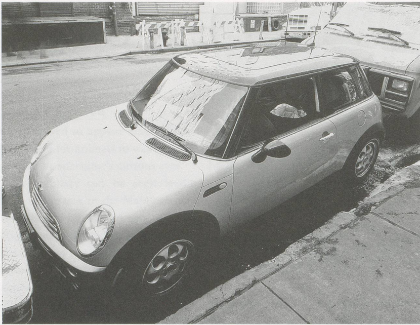
MICHAEL ELMGREEN AND INGAR DRAGSET, intervention / Intervention, Wrong Gallery, New York, 2005.