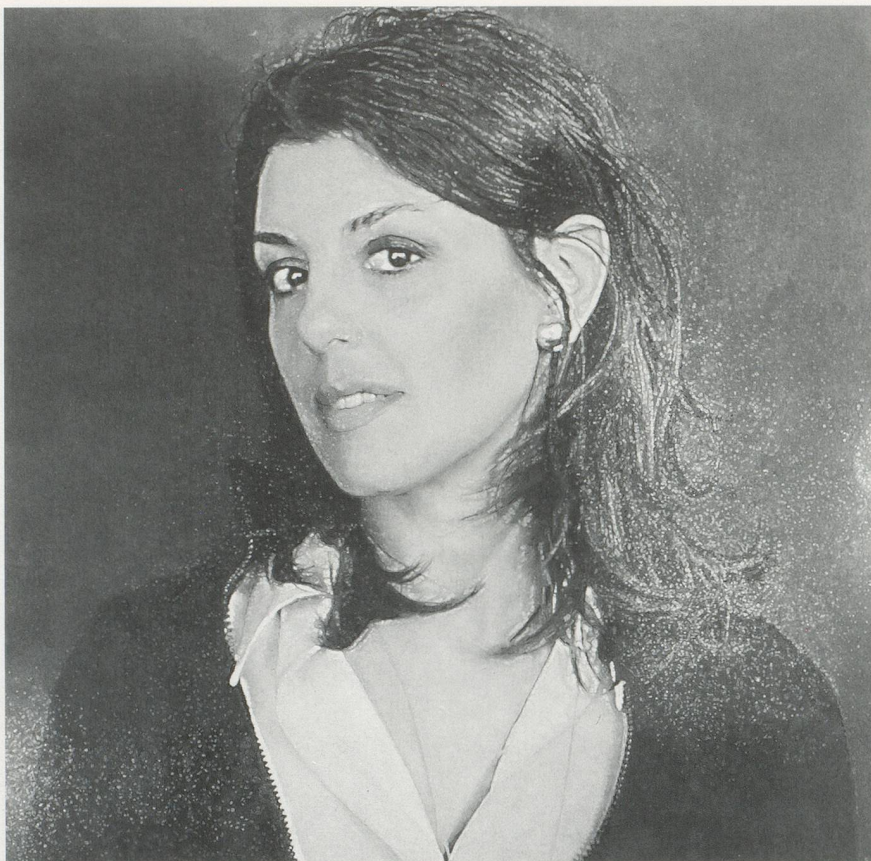
RUDOLF STINGEL, UNTITLED, 2005, oil on canvas, 118 x 118 x 2" / OHNE TITEL, Öl auf Leinwand, 299,7 x 299,7 x 5,1 cm.