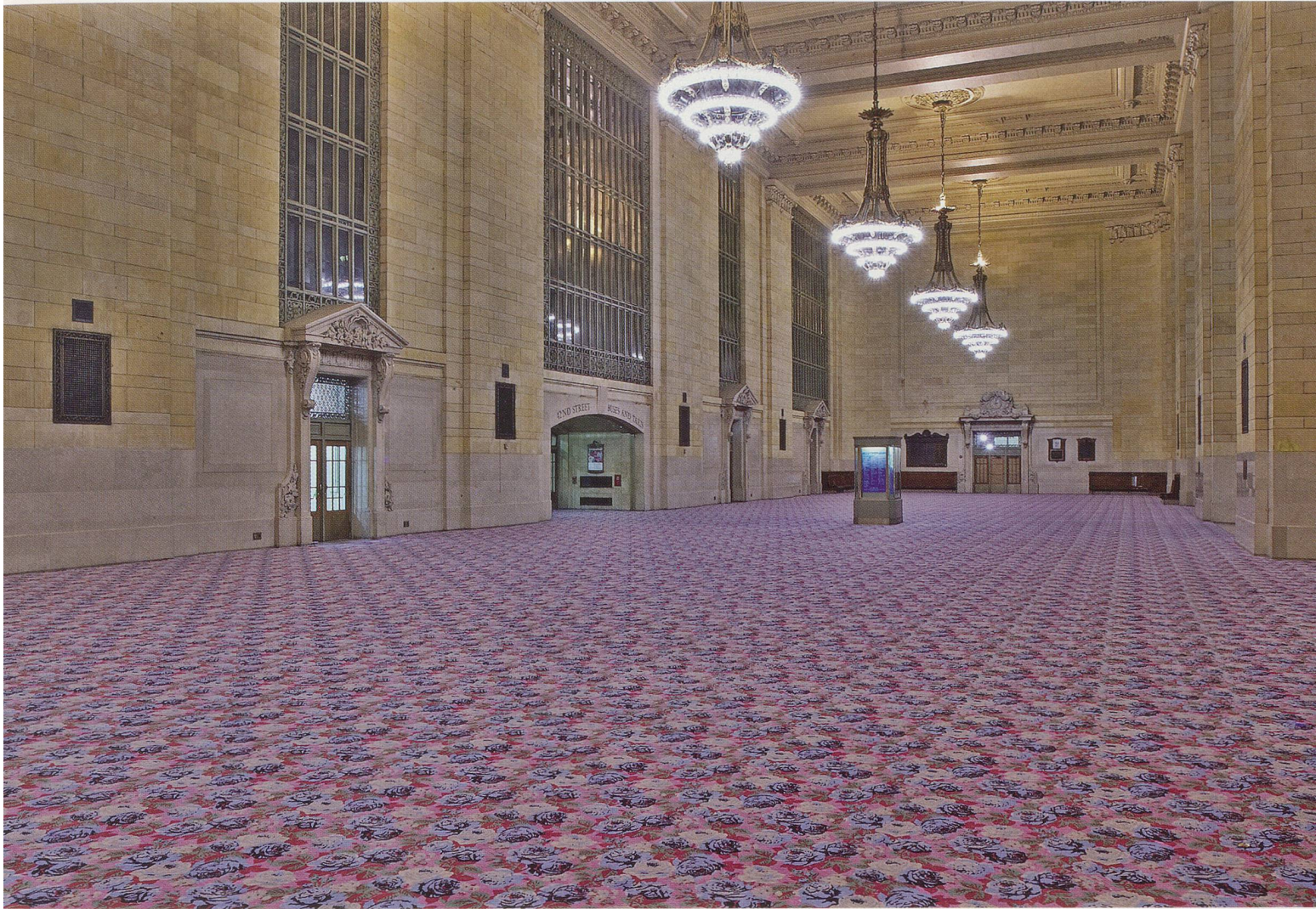
RUDOLF STINGEL, PLAN B , 2004, printed nylon carpeting, dimensions variable, installation view Grand Central Terminal, New York / bedruckter Nylontepich, Format variabel, Installationsansicht.