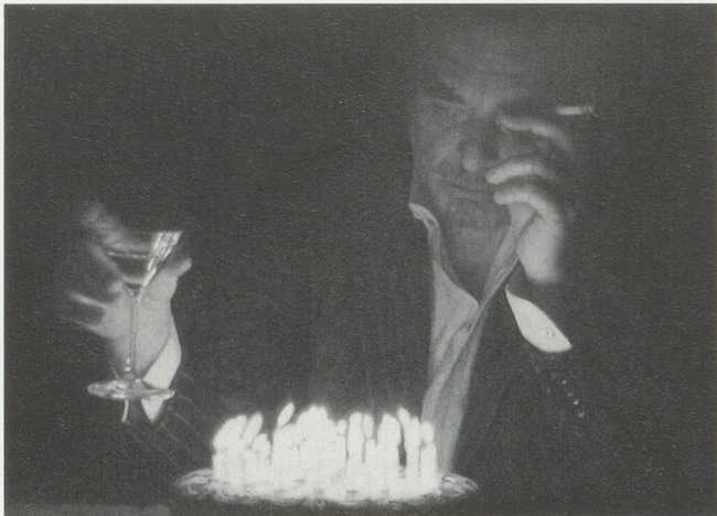
RUDOLF STINGEL, UNTITLED (BIRTHDAY) , 2006, oil on canvas, 15 x 20 1/2" / OHNE TITEL (GEBURTSTAG) , Öl auf Leinwand, 38,1 x 52,1 cm.