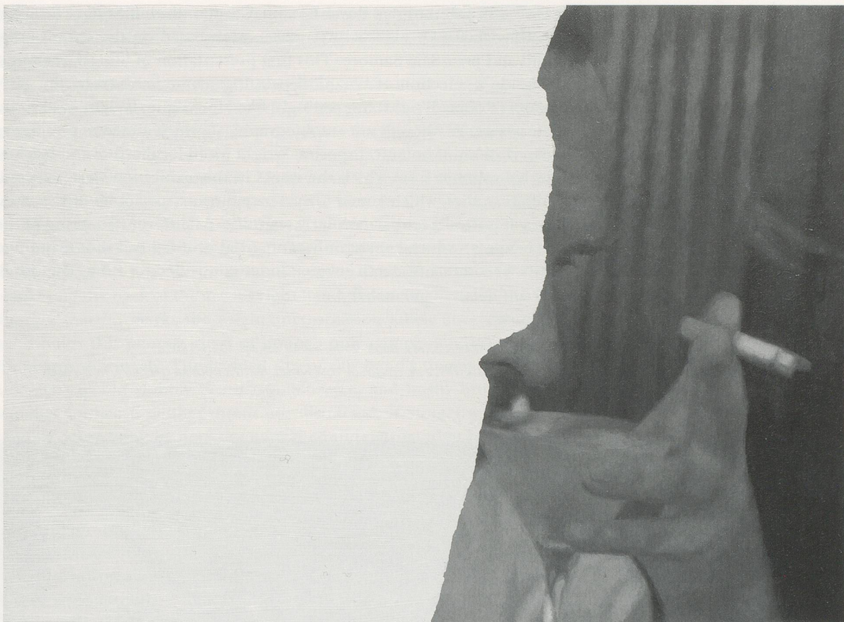
RUDOLF STINGEL, UNTITLED (AFTER SAM) , 2006, oil on canvas 15 x 20 1/2" / OHNE TITEL (NACH SAM) , Öl auf Leinwand, 38,1 x 52,1 cm.

tice historically, as he has adopted a more romantic and intersubjective approach. But this return to the conventions he once critiqued still systematically involves art contexts, for Stingel inquires not just "Who am I?" but more importantly he asks himself "Who am I as an artist after all that I have produced and at this stage in my life?"