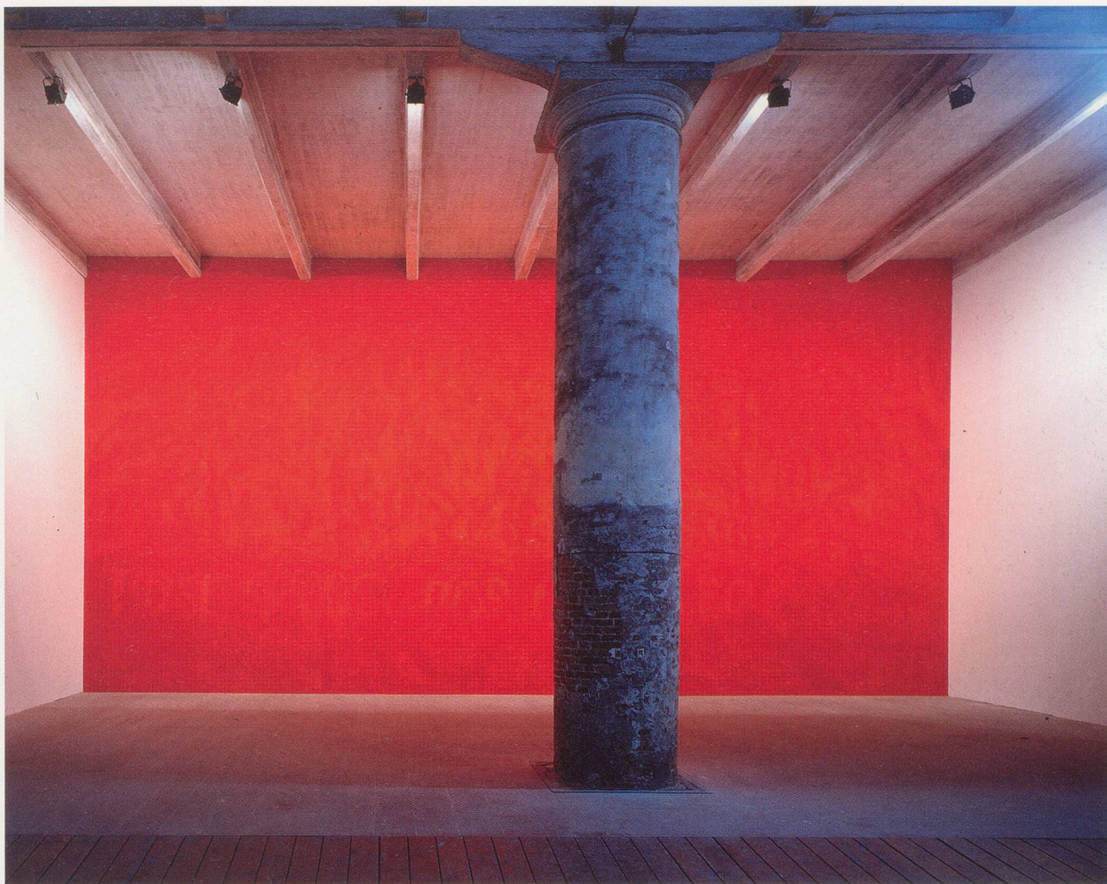
RUDOLF STINGEL, APERTO 93, installation view / Ausstellungsansicht, Venice Biennale, 1993.