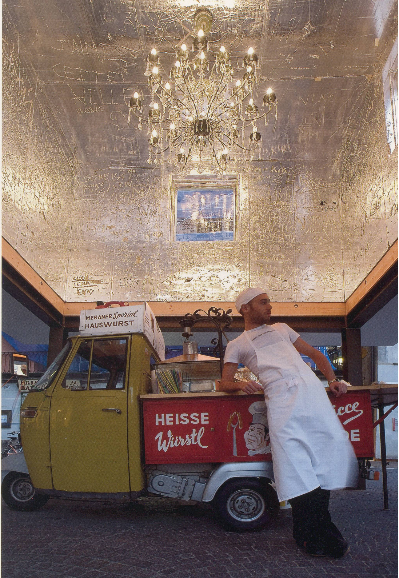
RUDOLF STINGEL in collaboration with Franz West, UNTITLED, 2006, kiosk installation, Bolzano, Italy.