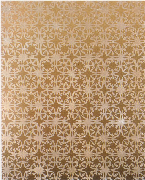
Top left and right: RUDOLF STINGEL, UNTITLED, 2004, oil and enamel on canvas, 82 7 / 8 x 67 1 / 8 " / OHNE TITEL, Öl und Email auf Leinwand, 210,5 x 170,5 cm.