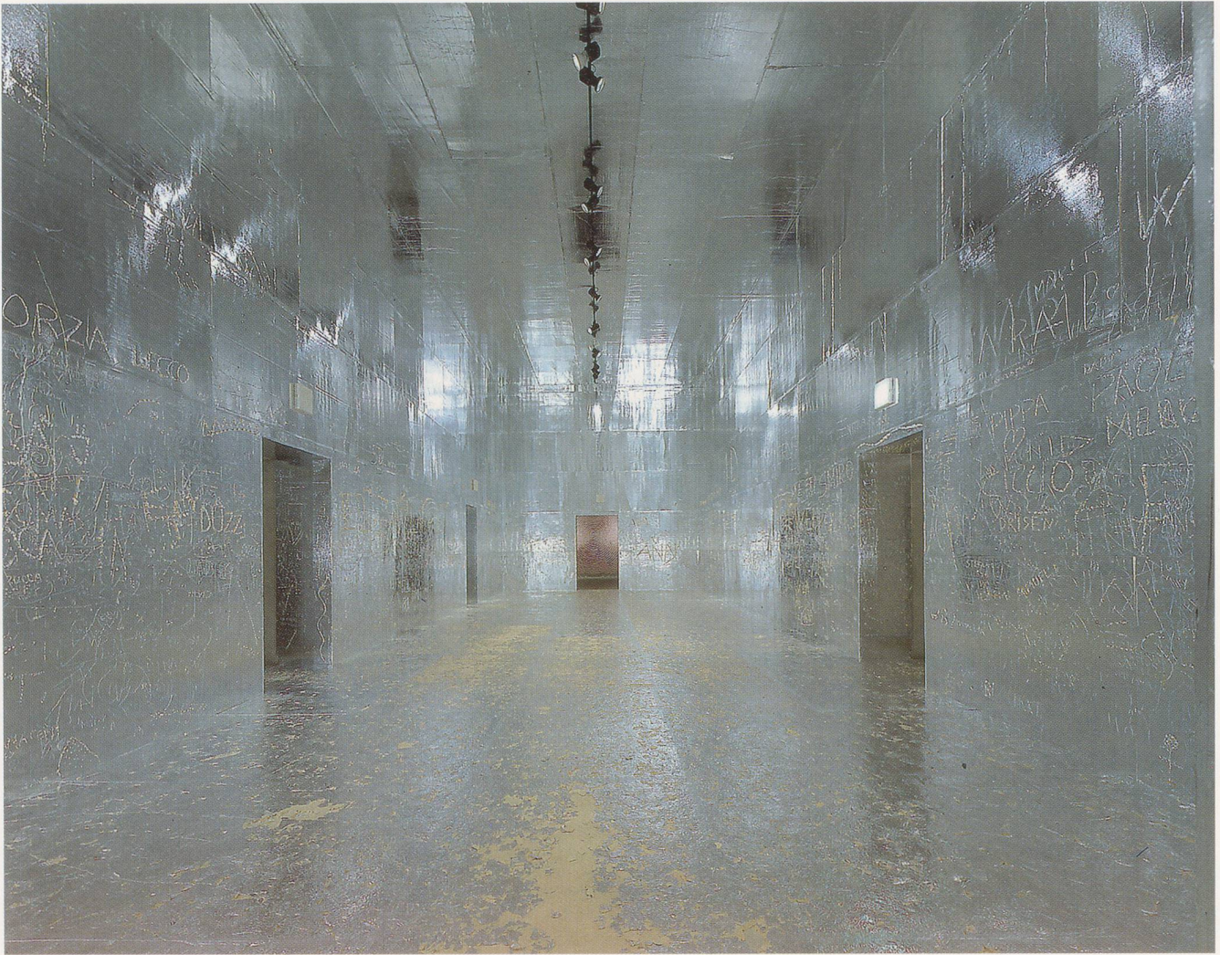
RUDOLF STINGEL, installation view / Ausstellungsansicht , Museo d'Arte Moderne e Contemporanea, Trento, Italy, 2001.