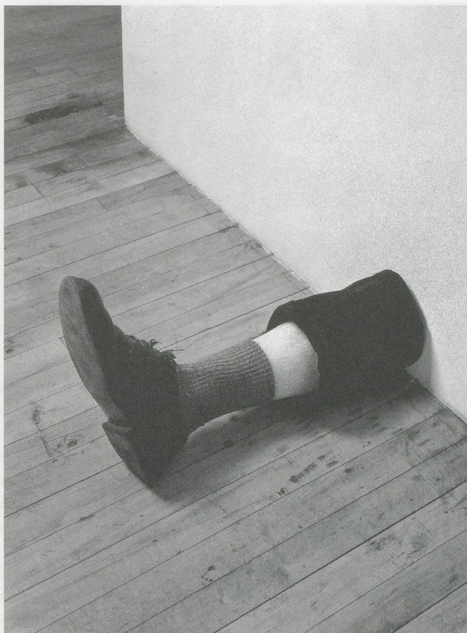
ROBERT GOBER, UNTITLED, 1989–1990, beeswax and human hair / OHNE TITEL, Bienenwachs und menschliches Haar.

ly formed mushroom cloud slowly building and raining down like a firecracker, the chills never diminished. As well, Robert Gober's wax leg first repulsed me, but I couldn't tear my eyes away. I can still see it installed at the base of the wall, alone and detached, with a sock and pant leg, a shoe without its pair. The stubble and the pale, waxy flesh of this disembodied limb were eerie and bizarre to me: a simple idea, a leg cut off, amputated,