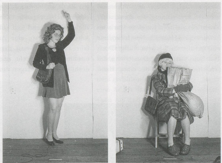
CINDY SHERMAN, UNTITLED, 1976/2005, black and white photograph, 7 3/16 x 5" / OHNE TITEL, schwarz-weiss Photographie, 18,2 x 12,7 cm.

dieses Ballett einer langsam wachsenden, vollendet geformten und wie ein Wasserfall oder ein Knallfrosch herabregnenden Wolke angeschaut habe, der Schauer lässt nie nach. Bei meiner ersten Begegnung mit Robert Gobers Wachsbein fühlte ich mich angewidert, doch ich konnte den Blick nicht abwenden. Ich sehe noch heute vor mir, wie es im unteren Wandbereich angebracht war, einzeln und abgetrennt, mit Socke, Hosenbein und Schuh. Die behaarte und blasse, wächserne Haut dieser körperlosen Gliedmasse wirkte auf mich total unheimlich und bizarr: eine einfache Idee, ein Bein, das abgeschnitten, amputiert, aber als Ornament wieder angesetzt wurde. Dieses frankensteinartig wieder zum Leben erweckte Bein weckt bis heute in mir den Wunsch, mir den Arm abzuhacken.