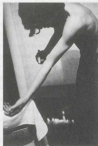
LARRY CLARK, photograph from "Tulsa," 1971 / Photographie aus "Tulsa".

With her quivering voice and delicate line, Iannone grabs your hand and leads you into her utopian Eden.