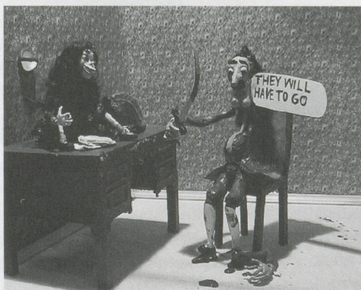
NATHALIE DJURBERG, THE NECESSITY OF LOSS , 2006, still from DVD / DIE NOTWENDIGKEIT DES VERLUSTS , Still aus DVD.

Manchmal ist ein Werk oder ein Werkzyklus derart intensiv und direkt, dass das Hinschauen schwer fällt. Die frühen Performancearbeiten von Otto Mühl sind abstossend und ekelregend und gleichwohl sind seine frühen Videoarbeiten faszinierend. Ebenso scheinen die abstossend-süssen Märchen der jungen Schwedin Nathalie Djurberg in jeder Hinsicht gegen die Regeln des Anstands zu verstossen. In ihnen treiben sich lauter lasterhafte kleine Mädchen, fiese Väter, rachsüchtige Mütter, verlorene Söhne und unerhört menschliche (und sexualisierte) Tiere herum. Die absurden, unbedachten Handlungen treiben uns die Schamröte ins Gesicht; auch wenn wir nur animierten Figuren aus Ton bei ihrem Treiben zuschauen, haben wir trotzdem das Gefühl, beim Zuschauen eines Pornofilms ertappt worden zu sein (und wir können ihn nicht abschalten). Die Videoarbeiten von Paul McCarthy, insbesondere die frühen wie SAILOR'S MEAT (Matrosenfleisch, 1975) oder BOSSY BURGER (1991), haben den gleichen Effekt. Man möchte den Bildschirm verdecken, kann sich aber nicht abwenden. Die Arbeit will gesehen und angeschaut