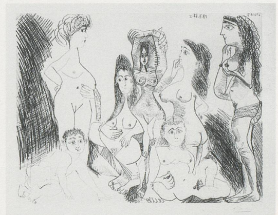
PABLO PICASSO, from the 347 series, 1968, etching / aus der Serie 347, Radierung