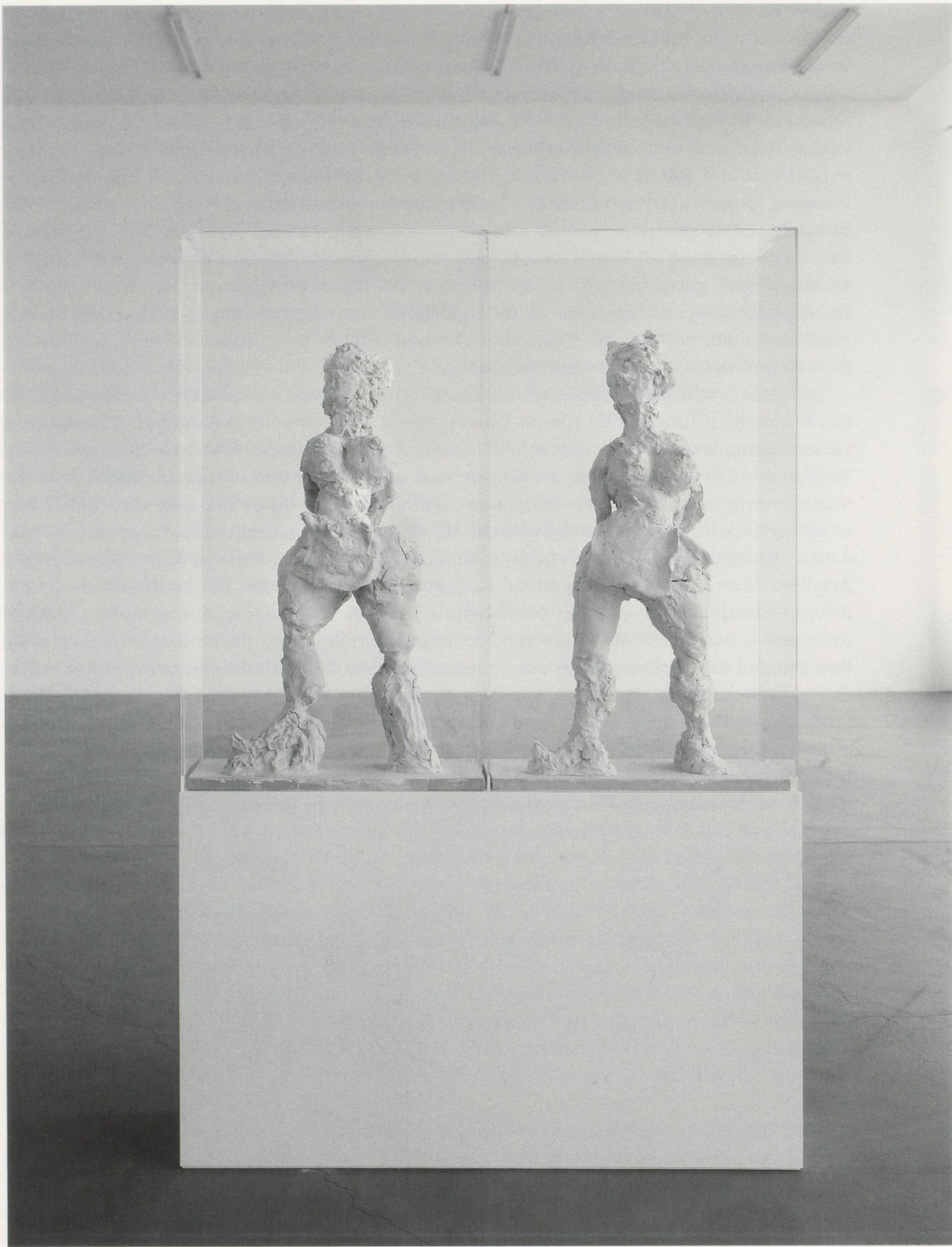
REBECCA WARREN. THE TWINS , 2004, reinforced clay, perspex vitrine, plinth, 78 3 / 4 x 52 x 14 1 1 / 8 " / DIE ZWILLINGE, verstärkter Ton, Plexiglas-Vitrine und Sochel, 200 x 132 x 36 cm.