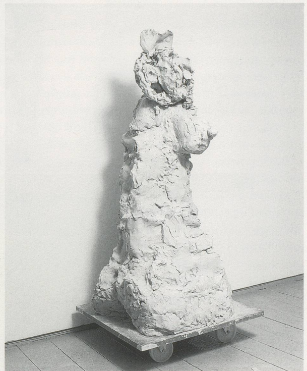
REBECCA WARREN, DEUTSCHE BANK , 2002, reinforced clay, MDF, wheels, 29 1 / 8 x 29 1 / 8 x 29 1 / 8 " / verstärkter Ton, MDF, Räder, 166 x 74 x 74 cm.

There are stylistic points of comparison between Warren and Bacon. These include a shared emphasis on reductive bodily physicality and truncated monstrosity, as well as similarities between Bacon’s spermy, Vaseline smearings and Warren’s slippery sexualizing of clay. That there could be “a female Francis Bacon” is a strangely appealing idea to consider, both in the abstract and in respect to Warren’s work. But it wouldn’t be correct to attempt to describe Warren as this impossible person. Unlike Bacon, her work is self-deprecating and not grandiose, and is infinitely wittier. More importantly, the idea of love—damaged and dysfunctional as this love might be—is not extinguished, and, in spite of all the debauchery and outrage, is characteristically the voice of Rebecca Warren.