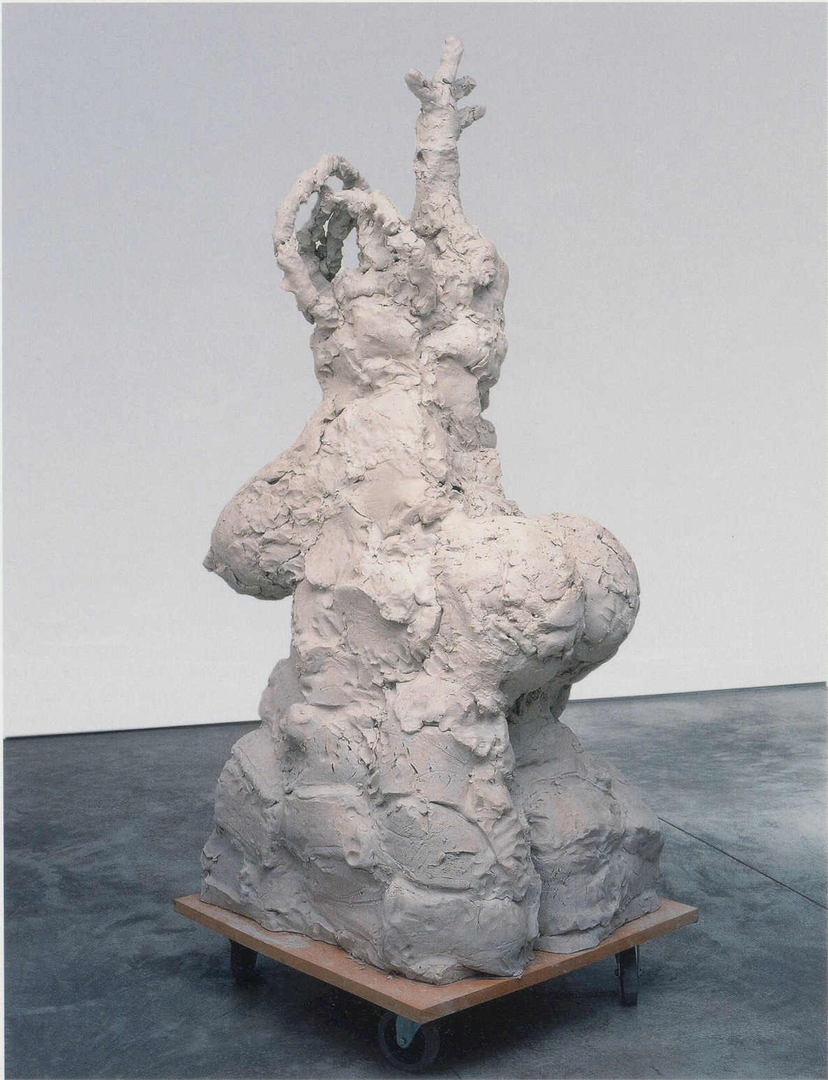
REBECCA WARREN, HOMAGE TO R. CRUMB, MY FATHER , 2003, reinforced clay, MDF, wheels, 83 7/8 x 32 1/8 x 32 1/8" / HOMMAGE AN R. CRUMB, MEINEN VATER , verstärkter Ton, MDF, Räder, 213 x 81,5 x 81,5 cm.