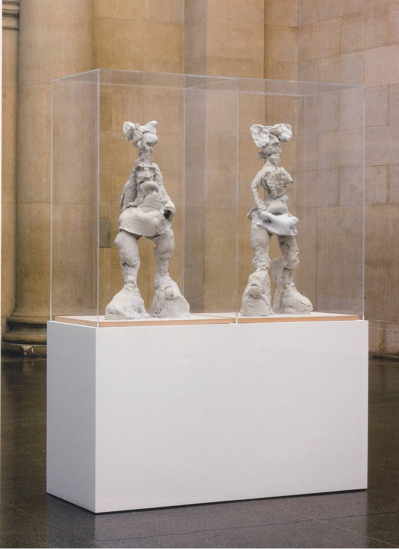
REBECCA WARREN, COME, HELGA , 2006, reinforced clay, paint, plinth, perspex, 84 5/8 x 24 x 60 7/8" / KOMM, HELGA , verstärkter Ton, Farbe, Sochel, Plexiglas, 215 x 61 x 154,5 cm.