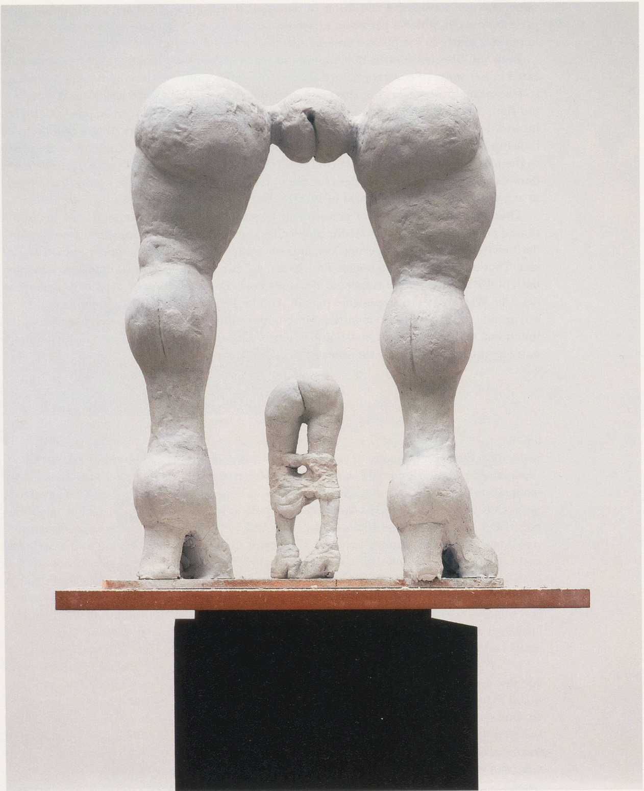
REBECCA WARREN, ROBERT CRUMB, 1998, reinforced clay, MDF, stacked plinths, 77 1/2 x 12 x 12" / verstärkter Ton, MDF, gestapelte Sockel, 196,9 x 30,5 x 30,5 cm.