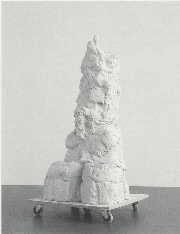
REBECCA WARREN, PRIVATE SCHMIDT , 2004, reinforced clay, MDF, wheels, 72 7 / 8 x 35 7 / 8 x 35 7 / 8 " / SOLDAT SCHMIDT , verstärkter Ton, MDF, Räder, 185 x 91 x 91 cm.

the particular bodily types that are regarded so unfavorably in females these days: wide hips, thick goose-thighs, big bottoms, and general big-bonedness. Elements of many sexual paraphilias can be seen in Crumb's work, such as Saliromania , which is the deriving of erotic pleasure from soiling or spoiling the object of desire. (This may include tearing or damaging their clothing, covering them in mud or filth, or otherwise disheveling them—a fetish that can also involve the defacing of statues or pictures of attractive people, especially celebrities, and the forming of collections of defaced art.) Crumb, as a cartoonist, also summons ideas of Schediaphilia (more humorously known as Toonophilia ), which is love or sexual arousal towards cartoon characters. Crumb's work, unlike Warren's, includes visceral hatreds, often towards conventionally beautiful women and the highly esteemed status they enjoy, and it is possible to consider Warren's appropriation of him as allusive of the need, or not, to "earn" or "deserve" love in this world—for men as well as women—much of it centered around exaggerated ideas of beauty.